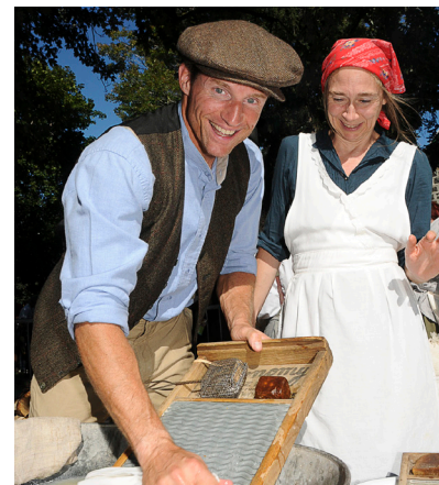
Festival Métiers & Traditions de Longueuil 2013.