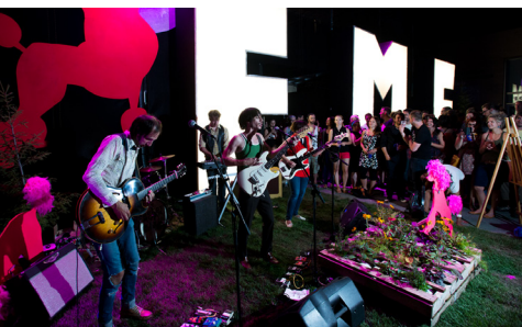
Festival de musique émergente d'Abitibi-Témiscamingue 2013

Le 10 juillet dernier s'est tenue la Commission élargie sur la commercialisation de la musique enregistrée et du spectacle. Mise sur pied par la SODEC, cette journée de réflexion impliquait les principaux intervenants du milieu de la musique au Québec.