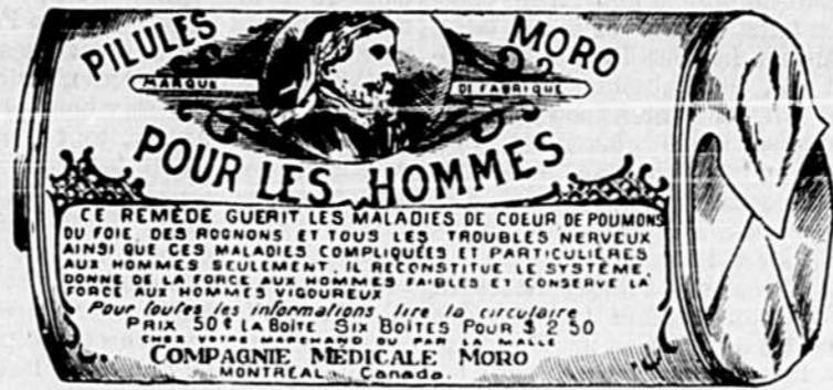
Fac-simile exact d'une boîte de Pilules Moro.

Donnez-nous un homme brisé par les excès, la dissipation, un travail trop dur, les tracas, ou par toute autre cause qui ait sapé sa vitalité, avec les Pilules Moro nous le rendrons aussi vigoureux en tous points, que n'importe quel homme de son âge.