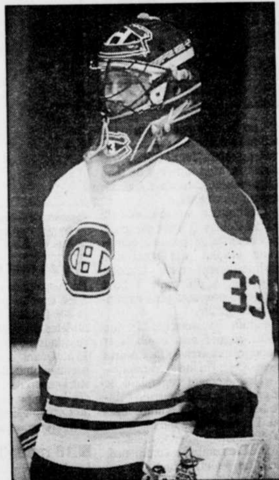
Il semble que les amis de Ron Tugnutt sont un peu tannés de la trop grande place occupée par Patrick Roy avec le Canadien.

En fait, il a trouvé une bien meilleure source. J'ai une bonne idée là-dessus. Et, en fin de semaine, il avait d'autres informations qu'il me