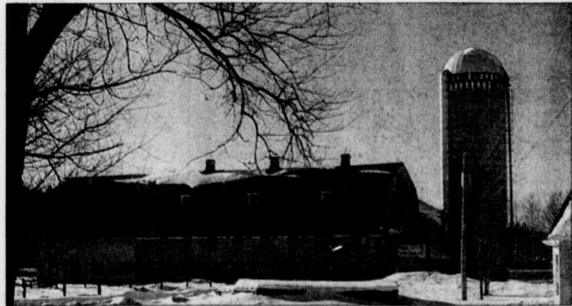
La magnifique ferme Beaux-Lieux, à Rivière-Bleue, dans le Témiscouata.

Avant de fermer les livres, pas question de passer sous silence des années de labeur. Maintenant avec un plus de temps, peut-être que les Beaulieu iront jusqu'à Saint-Pierre et Miquelon visiter leur fille, très loin des exigences nouvelles en matière environnementale et de production avicole.