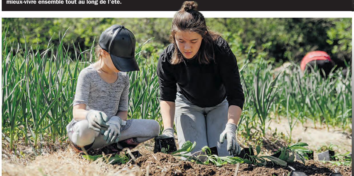
Les participants auront la chance d'acquies des techniques de jardinage écologiques et harmonieuses avec la nature.