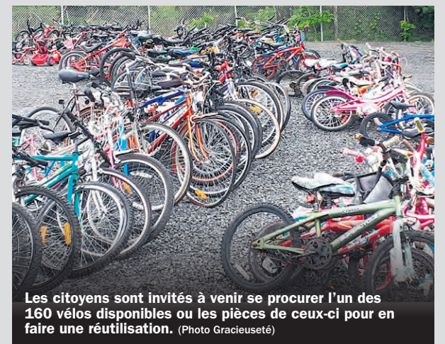
Les citoyens sont invités à venir se procurer l'un des 160 vélos disponibles ou les pièces de ceux-ci pour en faire une réutilisation.

Commentez en ligne | www.lexpressmontcalm.com