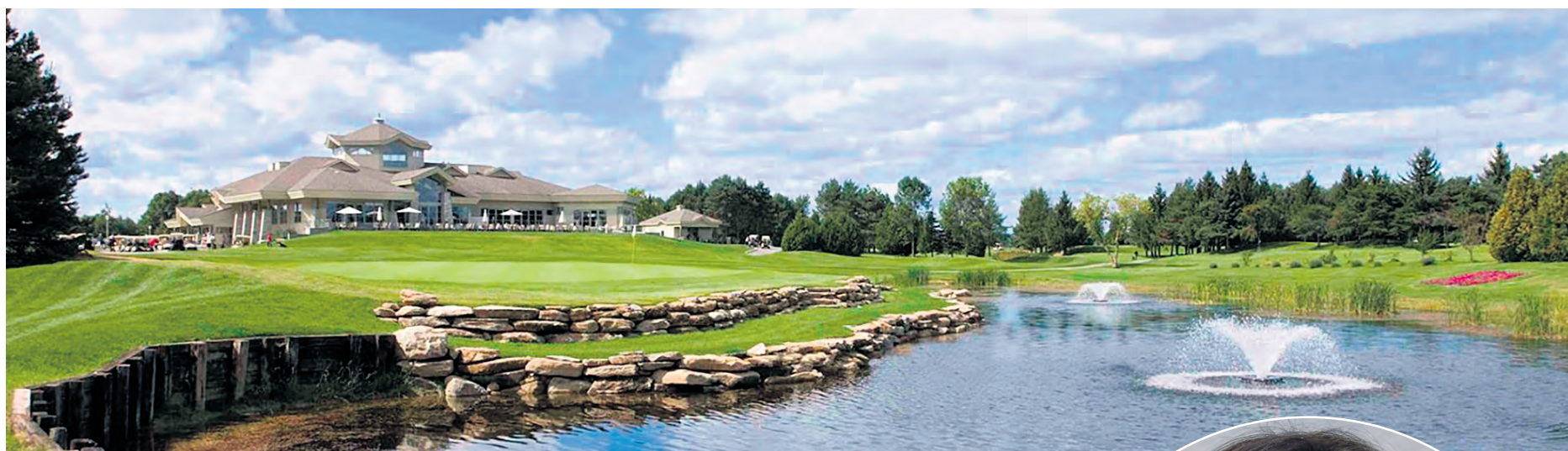
Le grand Gala 10 e anniversaire se tiendra au Club de golf Montcalm de Saint-Liguori.