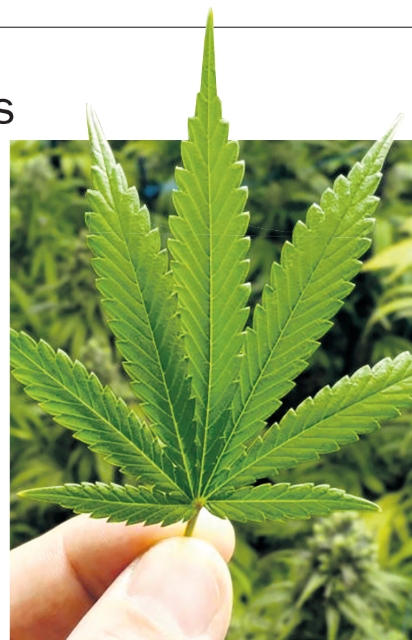
Sept perquisitions ont été effectuées dans six villes, dont Saint-Lin-Laurentides.

Toute information sur la contrebande et le trafic de stupéfiants peut être communiquée en tout temps et de façon confidentielle à la Centrale de l'information criminelle au 1 800 659-4264.