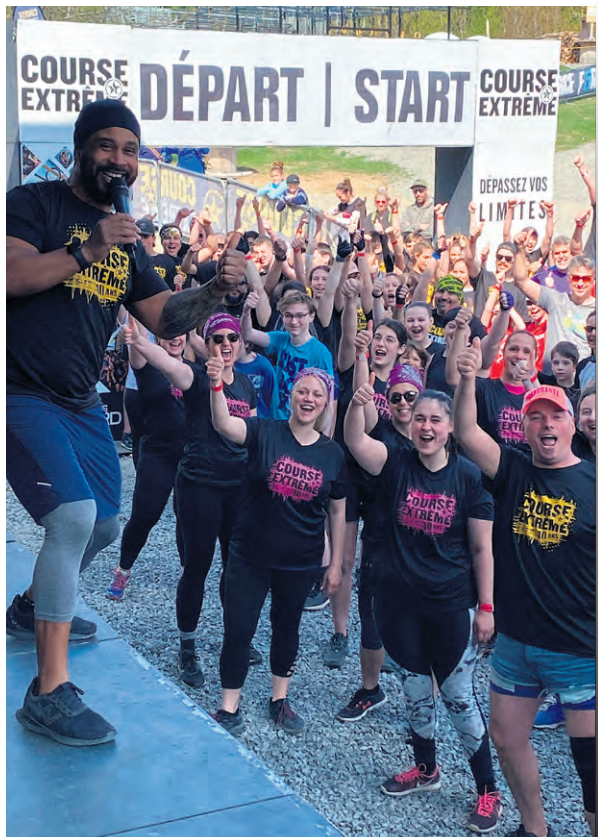
Ce sont près de 3 000 personnes qui se sont inscrites à la première course extrême du 45 Degrés Nord de Saint-Calixte.