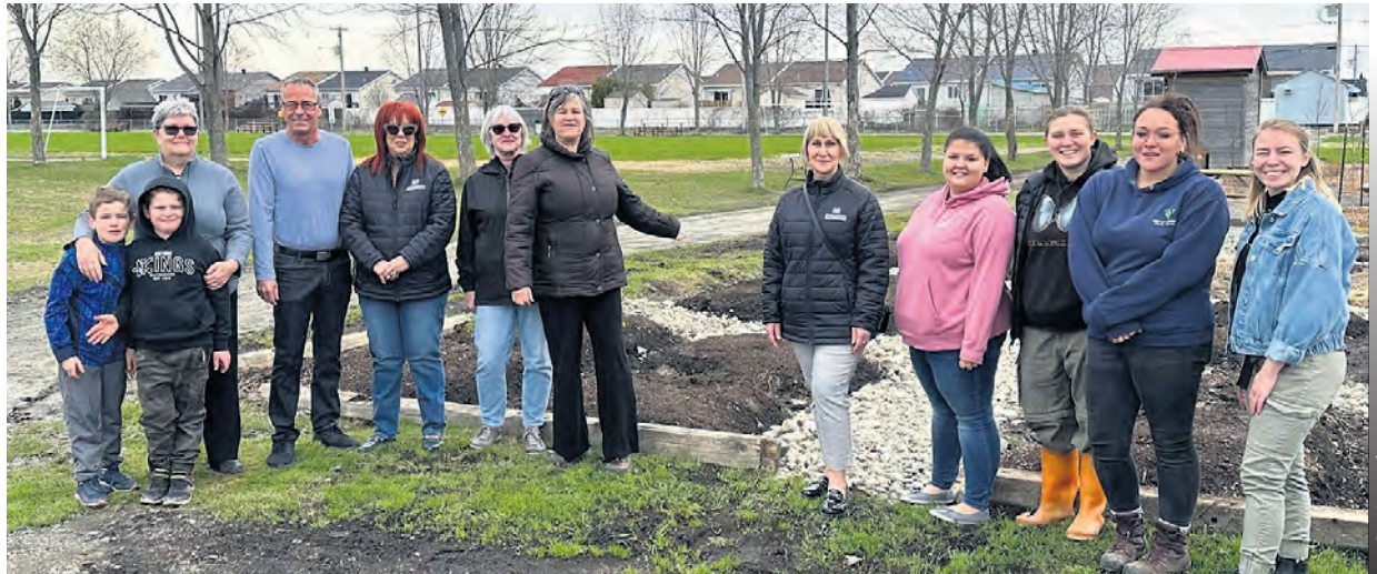
Le « Potager Éduqué » rassemblera citoyens, organismes communautaires et partenaires dans un projet inclusif favorisant le mieux-vivre ensemble tout au long de l'été.

Dans le cadre des activités éducatives animées par le Jardin Humani-Terre, les différents acteurs de ces organismes ainsi que la population générale seront invités à participer aux travaux liés à l'entretien du jardin, à échanger et à créer des liens