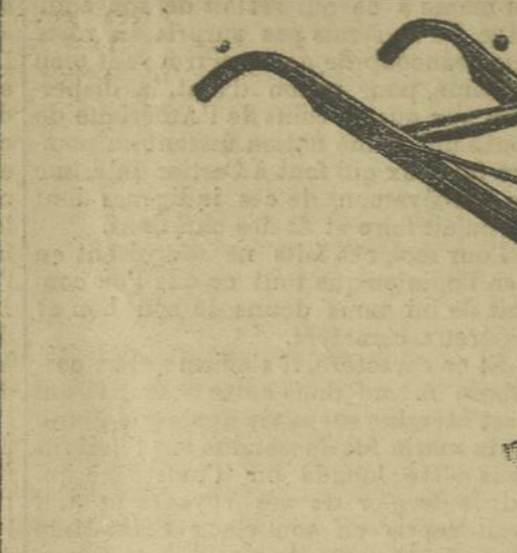
Charrues en acier de toutes sortes, Charrues à roues LITTLE GIANT et Charrues à une raie pour les côtes, Herse Semeurs, Faucheuses, Râteaux, Moissonneuses, Machines à battre, Lieuses, Cultivateurs, Engins, Bouilloires, Scieries Raboteurs, Machines à bardeaux, Barattes, Laveuses, etc.

Vienne, 25.—En recevant les délégations, l'empereur François-Joseph a dit que les relations étrangères de l'Autriche restaient les mêmes et que le gouvernement autrichien était complètement d'accord avec ses alliés. "L'Autriche, a-t-il ajouté, fait tout ce qu'elle peut pour assurer le développement pacifique de la situation européenne, situation qui est encore périlleuse. J'espère que les bien-