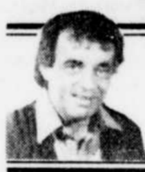
par Jacques ARTEAU

"Laurendeau ne se bat pas, il faut le battre, exceptionnel de voir