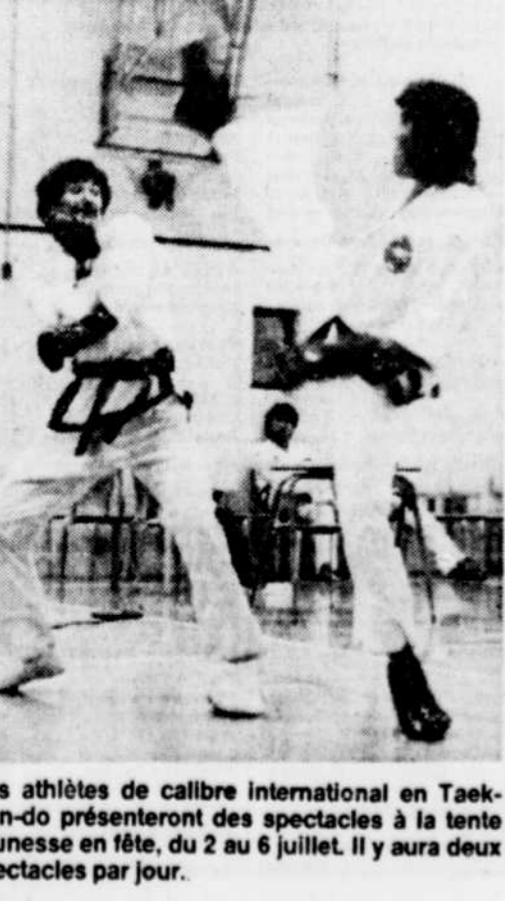
Des athlètes de calibre international en Taekwondo présenteront des spectacles à la tente Jeunesse en fête, du 2 au 6 juillet. Il y aura deux spectacles par jour.