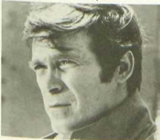
L'accusé mène l'enquête