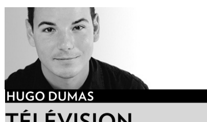
HUGO DUMAS TÉLÉVISION

Déjà cinq épisodes de la nouvelle sitcom de TQS, Grande fille , ont été tournés en haute définition dans les anciens studios occupés par Loft Story , à LaSalle. Et pourtant, peu d'informations ont filtré sur cette nouveauté, qui devrait prendre les ondes du Mouton noir en janvier 2008.