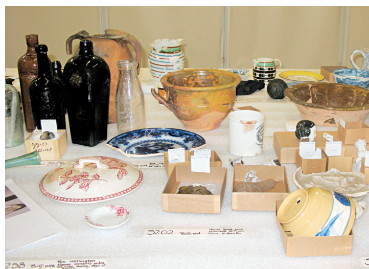
Échantillonnage d'artefacts parmi les 8000 objets constituant la collection de référence.

«Vous voyez cette grosse brique en roc? C'est un laitier. Un résidu issu de la fabrication de la fonte au haut fourneau. Imaginez quand on fait de la confiture de fraises, il y a une mousse qui se forme à la surface, que l'on enlève à la cuillère avant de mettre en pot. Eh bien, si l'on fait fondre de la fonte à haute température, il se forme à la surface