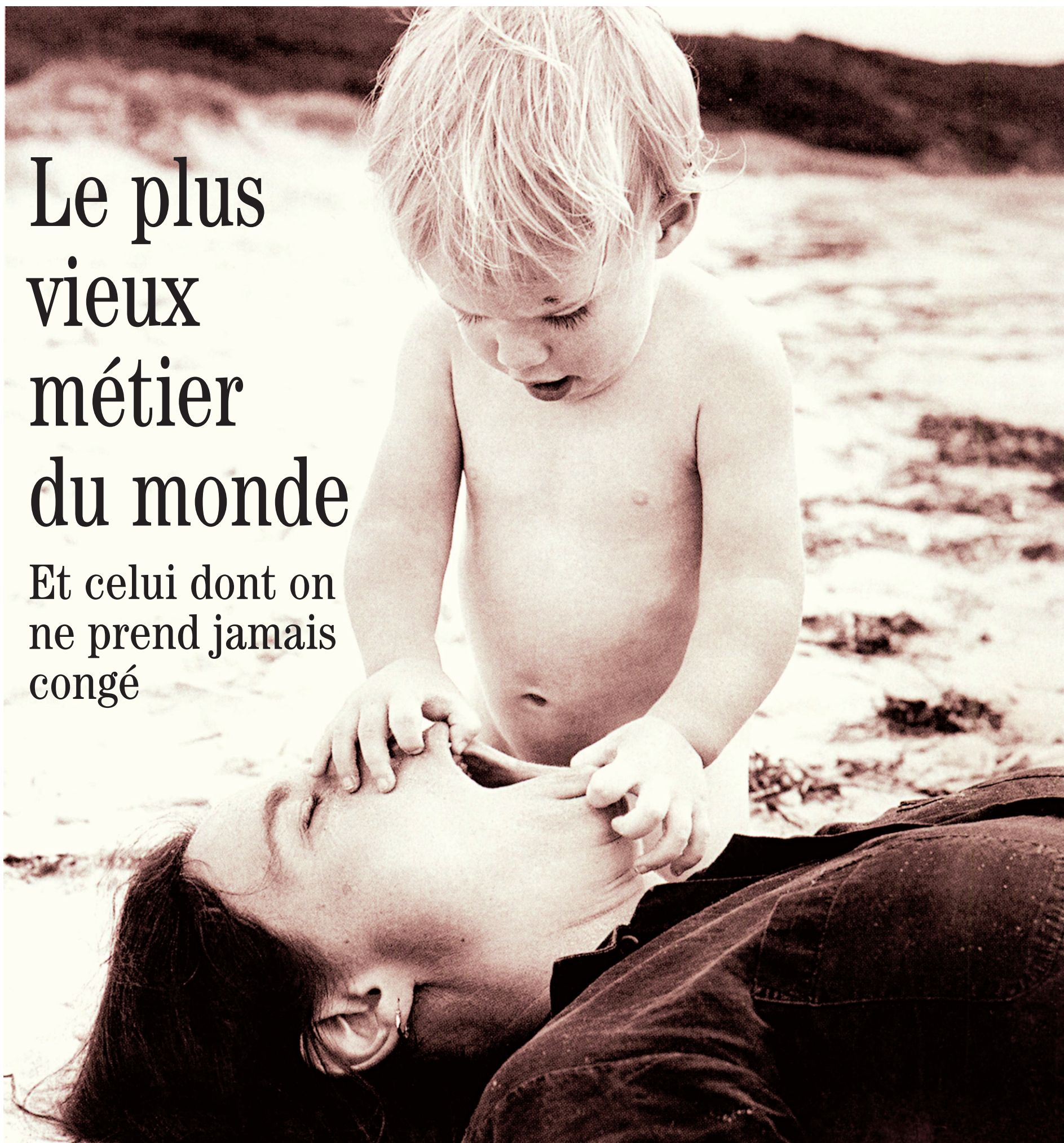
TIRÉ DU LIVRE POUR MA MÈRE

«On peut comparer la patience d'une mère à un tube de dentifrice. Il en restera toujours un peu au fond», une citation du livre Pour ma mère .