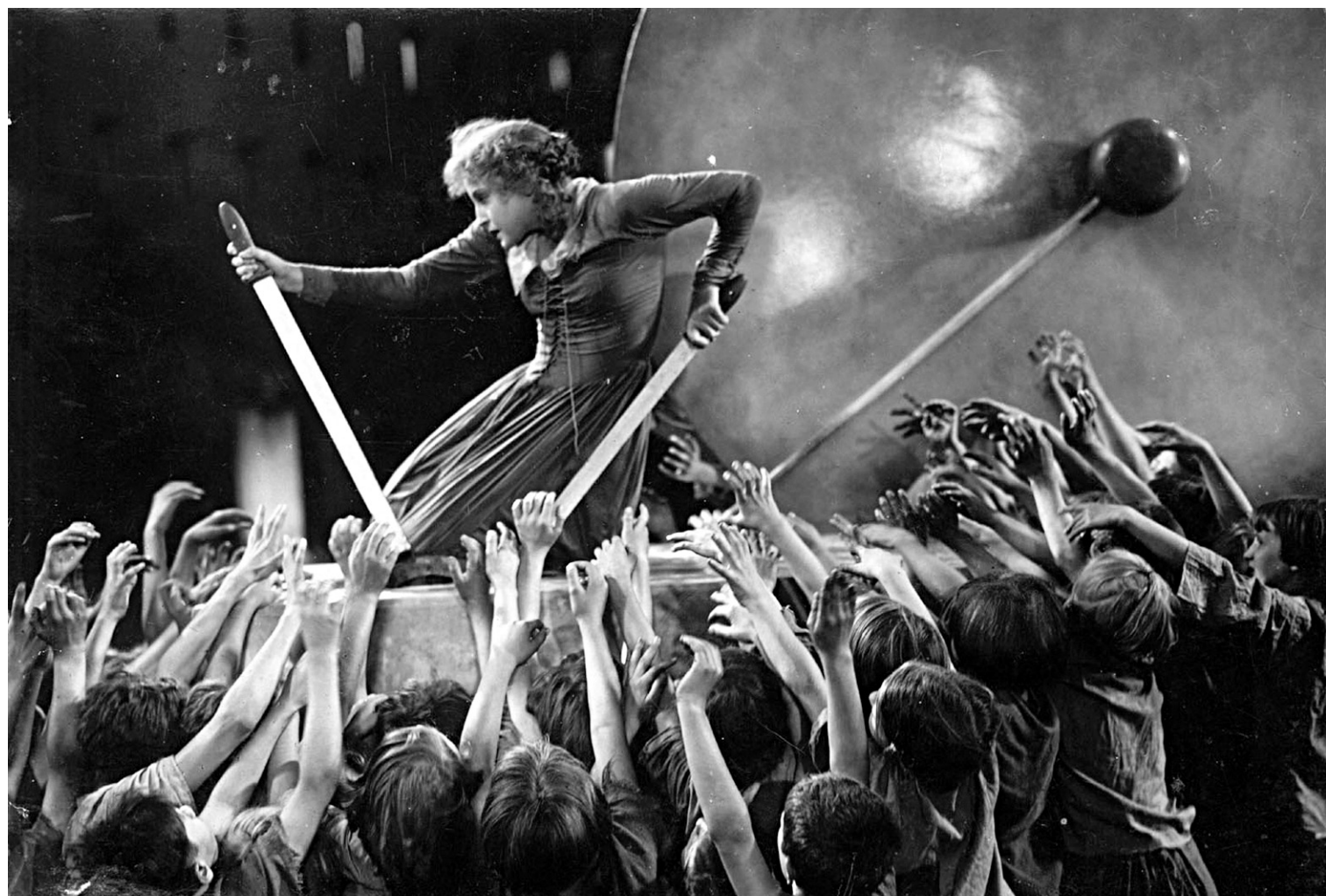
Les curieux voudront d'emblée savoir en quoi consistent les nouvelles scènes. Comparée à la précédente copie restaurée qui, elle, datait de 2002 et durait 124 minutes, cette mouture-ci affiche environ 150 minutes au compteur et plus de cohérence à l'image.