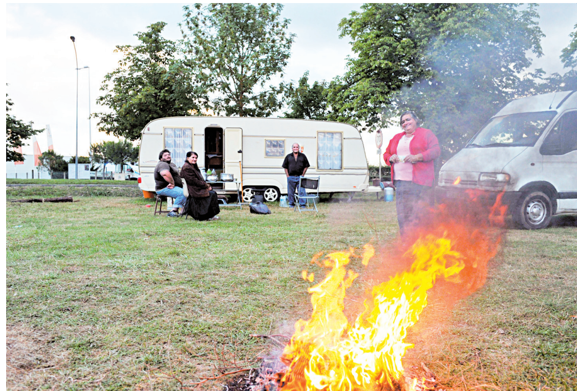
Campement de « gens du voyage » à Mont-près-Chambord, près de Blois.