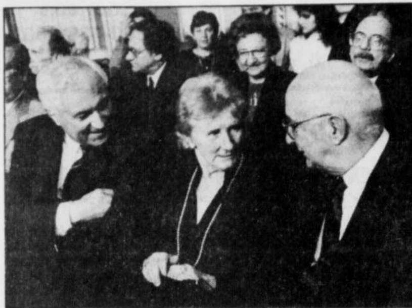
L'écrivaine Antonine Maillet était au nombre des lauréats de l'Ordre national du Québec.