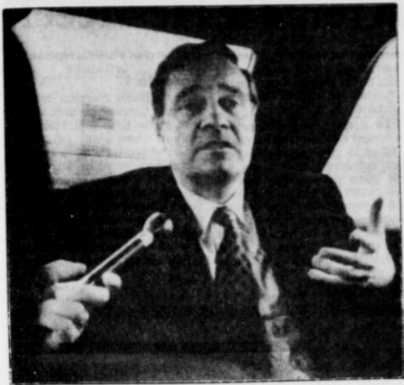
Paul Martin, candidat à la direction du Parti libéral du Canada, mène sa campagne en utilisant tous les moments disponibles. Ainsi, hier, dans la voiture qui le menait à l'aéroport d'Ottawa pour y donner une conférence de presse, il accordait une autre entrevue à un journaliste de la Presse Canadienne.