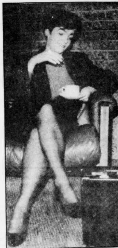
Sheila Copps a profité de la tenue du sommet pour chercher à obtenir des appuis dans cette course à la succession de John Turner.

conférence biennale doit avoir lieu, en 1992, pour que les intervenants socio-économiques de la région puissent faire le point sur les réalisations et les projets en hésitation.