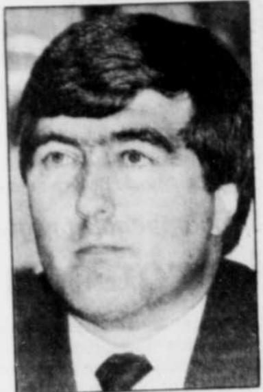
Le ministre Pierre Blais souhaite que le projet d'école de marine soit discuté et amélioré.