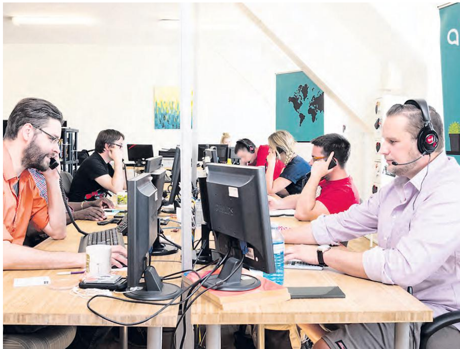
Alloprof est une solution gratuite pour réviser ses reprises d'examen.

En effet, le Ministère n'offre aucun soutien financier pour ces formations supplémentaires souvent indispensables à la future réussite scolaire.