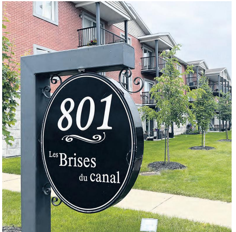
Les résidents de l'immeuble Les Brises du canal sont victimes de pressions afin de déménager.

Le Journal de Chambly a tenté de parler à Gestion Zagora inc. ainsi qu'à