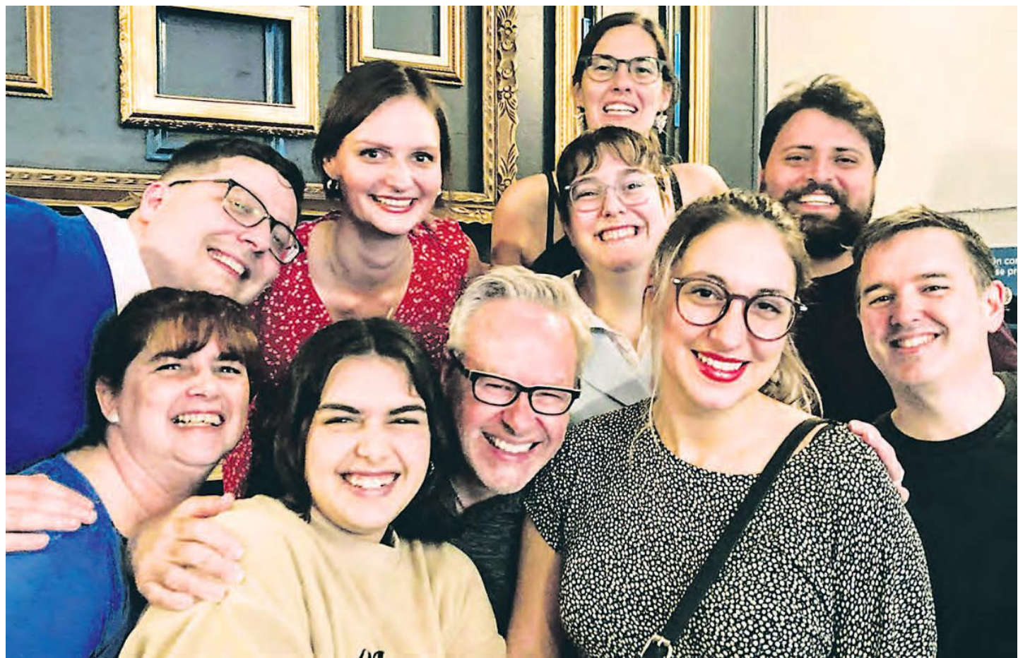
La troupe du Café-Théâtre de Chambly présentera C'est encore mieux l'après-midi du 15 juillet au 20 août.

« Maintenant, on en revient. On s'en sort. On recommence à créer et à pouvoir partager nos créations avec qui