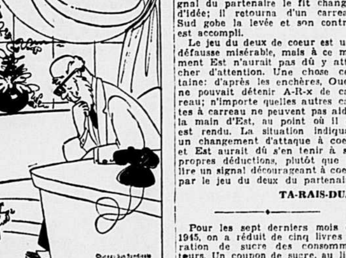
"Pauvre chien! Il a toujours des peines d'amour. Il est fou des chats."

IL N'Y A PLUS D'ENFANTS!... par Phillips