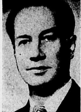
Martial Singher, éminent baryton du Metropolitan Opera que France-Film présentera au Saint-Denis, en septembre, au cours de sa 5e saison annuelle d'opéra.