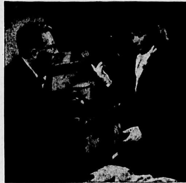
Les deux principaux interprètes du film "Without Love" sont Spencer Tracy et Katharine Hepburn. Ce film est actuellement à l'affiche du cinéma Palace.