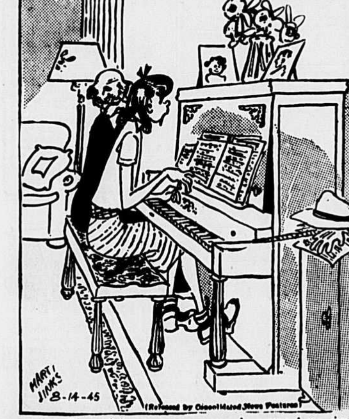
"M. Toscanini, croyez-vous que je pourrai un jour avoir la technique de Billy Eickstein?"