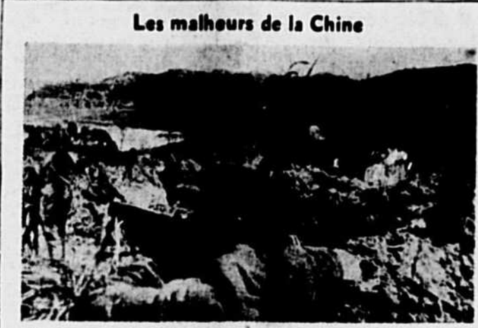
Les malheurs de la Chine

LONDRES, vendredi 17. (A.P.) — La radio de Moscou annonce ce matin que l'URSS et la Pologne ont signé un "traité sur la frontière russo-polonaise et une entente sur les compensations pour les dommages causés par l'occupation allemande. MOSCOU, 16 (A.P.) — Le haut-commandement soviétique rapporte ce soir que les Japonais contre-attaquent sur les trois fronts, en Mandchourie. La contre-offensive serait particulièrement forte contre le port coréen de Seishan sur la mer du Japon, mais les Japonais ont été repoussés. RANGOON, 16 (C.P.) — Comme l'ordre de cesser le feu n'est pas encore arrivé à Birmanie, on a révisé aujourd'hui qu'une puissante force de porte-avions de la flotte britannique des Indes orientales s'apprête à attaquer l'île Penang, à 375 milles au nord-ouest de Singapour, juste au moment où les hostilités ont cessé.