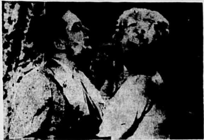
Paul Bernard et Françoise Rosay dans une scène du film "Pension Mimosas" dès samedi à l'affiche du Saint-Denis.