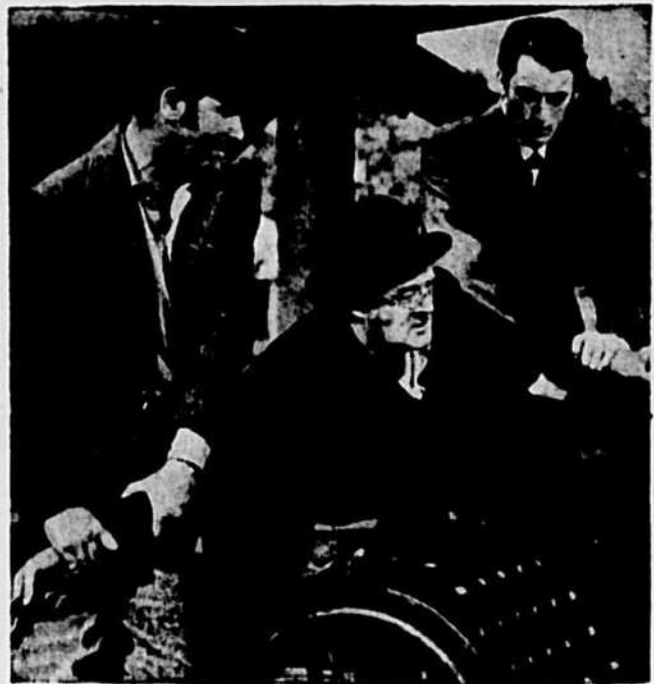
Lionel Barrymore, Preston Foster et Gregory Peck, dans une scène du film "The Valley of Decision", actuellement à l'affiche du cinéma Loew's.