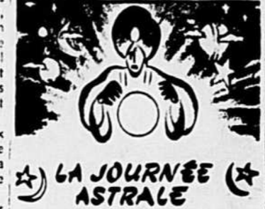
Si c'est votre fête par STELLA

Vous possédez plus de talent et d'aptitudes que la moyenne mais vous manquez d'agressivité quand il s'agit de faire valoir ou d'en tirer parti. Vos ambitions sont très hautes mais vous ne possédez pas la confiance en vous-même nécessaire à les atteindre. Vous êtes très modeste quand il s'agit de vanter vos qualités et vos exploits; vous êtes plutôt porté à les amoindrir. Vous devriez les exposer — jusqu'à un certain point — comme le fait les gens qui réussissent. Votre sens psychique est réellement merveilleux; on le reconnaît partout dans votre entourage et il est à la base de votre popularité. Vous ne ridiculisez jamais personne par vos remarques, mais vous tenez souvent votre assemblée en gaité par la vertu de votre esprit. A moins que vous ne vous traiciez un but défini dans la vie, vous irez à la dérive, n'obtenant aucune satisfaction et regrettant le fait. Rappelez-vous que les autres ne vous apprécieront pas si vous ne les faites d'abord vous-même. Intéressez-vous à l'amélioration de votre situation financière et à celle des autres. Vous êtes très fidèle en amour, et les femmes dont c'est aujourd'hui l'anniversaire feront des épouses et des mères excellentes.