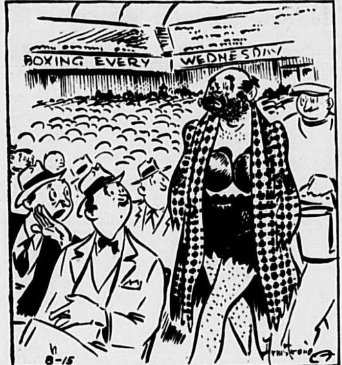
"Je te l'avais bien dit que ce gars là n'était qu'un vagabond!"