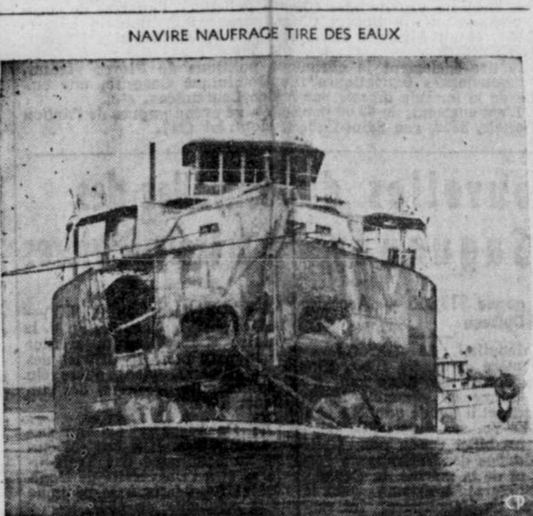
NAVIRE NAUFRAGE TIRE DES EAUX

Les travaux menés depuis le printemps dernier devraient permettre de compléter cette semaine la remontée complète à surface du fléau Saint-Lauréent du charbonnier "Milverton", qui avait fait naufrage le 24 septembre 1947 après une collision avec le pétrolier "Transtake", à 2 milles à l'ouest de Morrisburg, Ontario. 12 matelots du charbonnier avaient perdu la vie dans cet accident, l'un des plus désastreux qu'aient connus la navigation sur le cours supérieur du fleuve.