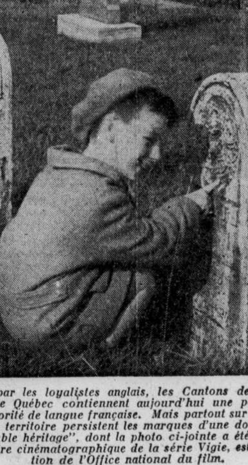
Colonisés par les loyalistes anglais, les Cantons de l'Est de la province de Québec contiennent aujourd'hui une population en grande majorité de langue française. Mais partout sur cet immense et prospère territoire persistent les marques d'une double civilisation. "Double héritage", dont la photo ci-jointe a été extraite, un documentaire cinématographique de la série Vigie, est une réalisation de l'Office national du film.