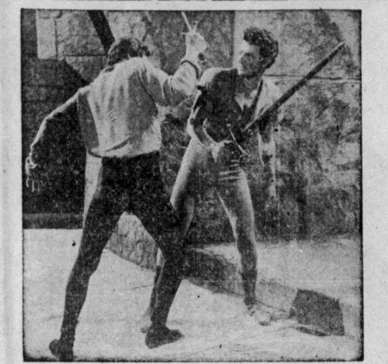
Un complot se prépare... vous en connaîtrez la nature en allant applaudir "Les Fils de Robin Des Bois" avec Cornel Wilde et Errol Flynn, que le Champlain présentera une deuxième semaine.