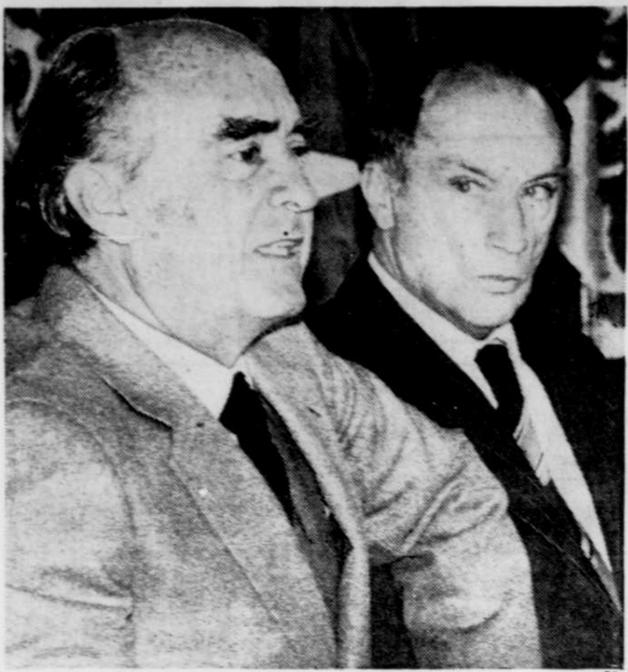
Le premier ministre du Canada, M. Pierre Elliott Trudeau, semble songeur pendant que le président mexicain M. Jose Lopez Portillo s'adresse aux journalistes après la ratification de l'entente sur les livraisons de pétrole entre les deux pays.