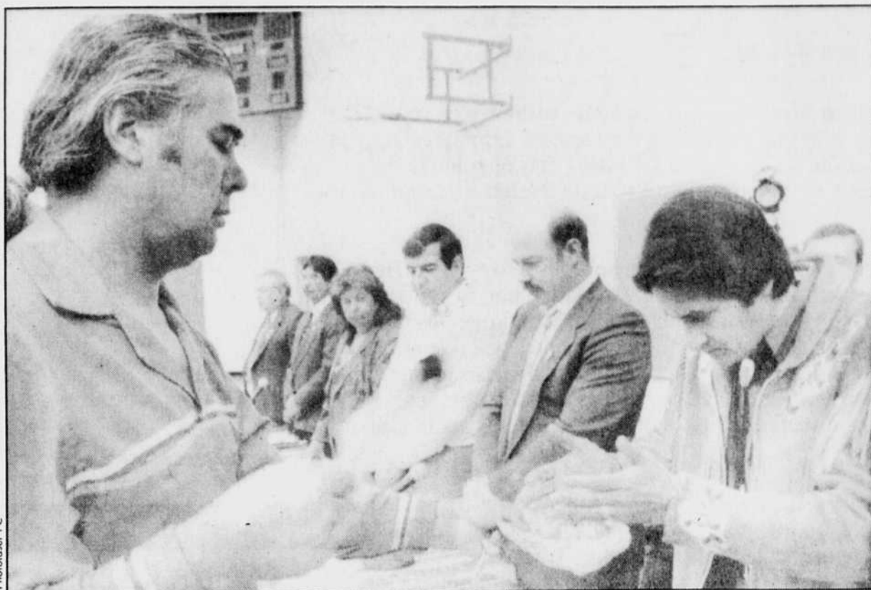
Le comité des Premières Nations a commencé hier, dans une réserve algonquine du Québec, ses audiences sur la question constitutionnelle. Ovide Mercredi, à droite, s'est purifié avec de la fumée, selon le rite ancestral, durant la prière du début.