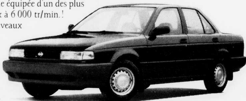
Sentra DLX 1992 à partir de 11 490 $*

Voyez votre concessionnaire Nissan pour une liste plus exhaustive des multiples bonnes raisons d'acheter une Sentra 1992.