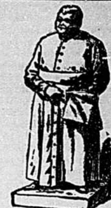
Table de Test No 1

LE MOT DE L'AVENIR EST DANS LE PEUPLE MEME NOUS VERROMS PROSPERER LES FILS DU ST LAURENT (S. SUITE)