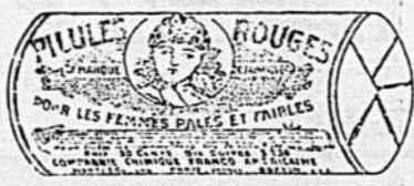
Le paguet est ainsi imprimé en encres rouges

Nous invitons aussi nos patientes à venir voir les Médecins Spécialistes de la CIE CHIMIQUE FRANCO-AMERICAINNE, si elles désirent avoir plus de renseignements sur leurs maladies ou sur le mode d'emploi des PILULES ROUGES, ou de leur écrire; les consultations, personnelles ou par lettres données par nos Médecins sont absolument gratuites et ne peuvent manquer d'être utiles aux femmes qui souffrent et veulent se guérir. Nos PILULES ROUGES se vendent 50c la boîte ou 6 boîtes pour $2.50, envoyées par la maille au Canada et au Etats-Unis sur réception du montant.