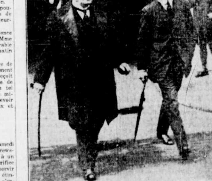
L'ancien premier ministre LLOYD GEORGE, et le nouveau, M. BON LAW, marchant ensemble avant la crise politique. Ils sont deux à séparer maintenant par les exigences politiques.