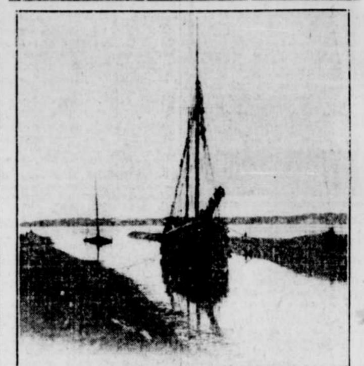
Cette vignette fait voir comment on se bat en Irlande: on a coulé un petit navire à l'entrée du canal Fraee, brûlé la maison de l'éage et fait sauter les escluses. Plusieurs navires chargés de vivres furent immobilisés dans ce canal par la suite.