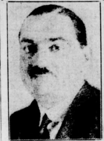
Sir Augustin EDWARDS, ambassadeur du Chili en Grande-Bretagne, qui a été nommé président de la Ligue des Nations.