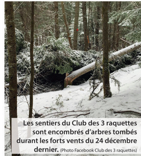
Les sentiers du Club des 3 raquettes sont encombrés d'arbres tombés durant les forts vents du 24 décembre dernier.

« On n'arrête pas! Chaque fois qu'on sort, c'est la scie