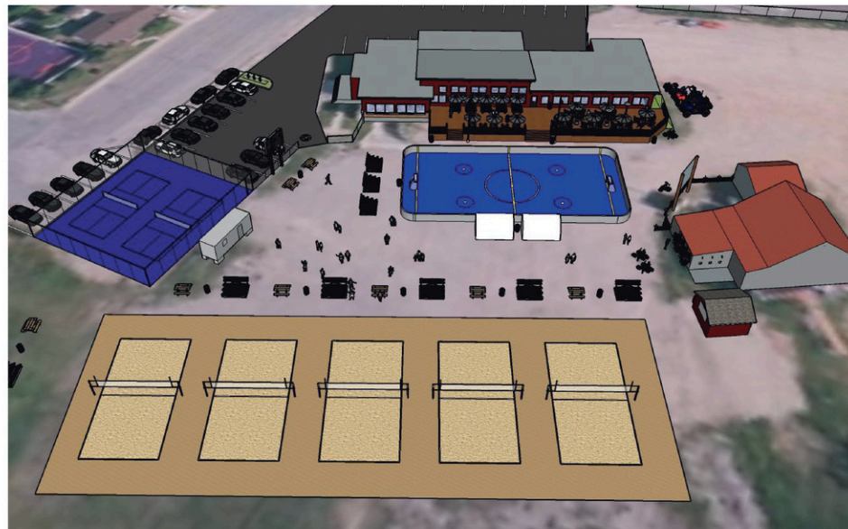
La maquette des infrastructures de loisirs à venir au centre de ski.

Le seul impact pour les contribuables en lien avec ce projet est la surface de dek hockey au coût de 30000$, la différence provient de subventions du gouvernement pour le projet total de 600000$.