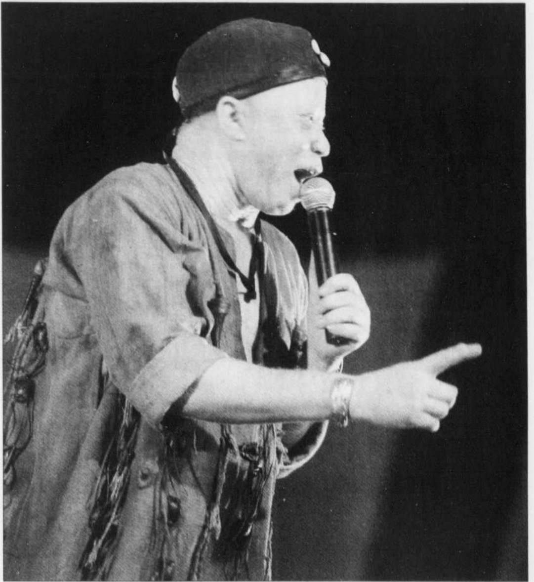
KAMPHILL AGENCY FRANCE-PRESSE

La rencontre téléphonique s'annonçait donc prometteuse. Cependant, en raison de retards d'avions, l'entrevue a été reportée six fois en deux jours. Finalement joint à son hôtel de Washington, d'où il venait d'arriver de Paris, la voix éteinte, visiblement lessivé par le décalage, je l'ai retrouvé peu enclin à se raconter une énième fois. Au début, les réponses ont été courtes. Pourquoi ce retour à Bamako en 2001? «Je ne suis jamais sorti pour habiter ailleurs. Qu'y a-t-il de changé au Mali? «La démocratie, c'est sympa.» Le fait d'être revenu a-t-il transformé