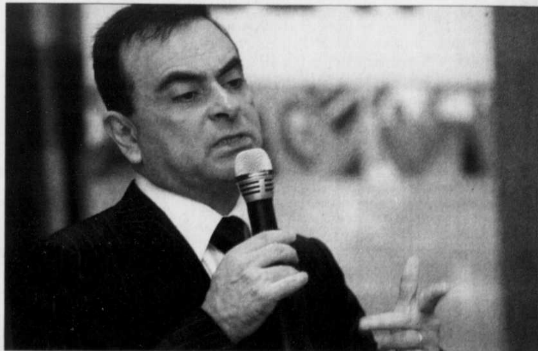
Carlos Ghosn assume la présidence de Nissan et de Renault.

Sur fond de résultat opérationnel en chute de 37,4 %