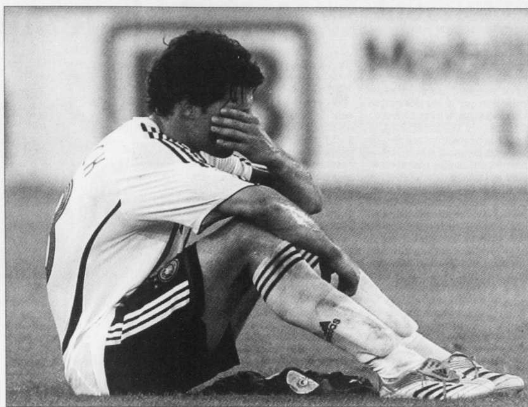
L'Allemand Michael Ballack a fondu en larmes à la fin du match perdu contre l'Italie hier.