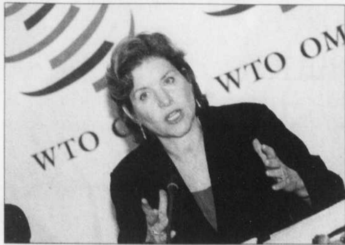
Susan Schwab, représentante spéciale américaine pour le commerce.

seul souci de l'administration Bush alors que se profilent les élections de mi-mandat en novembre.