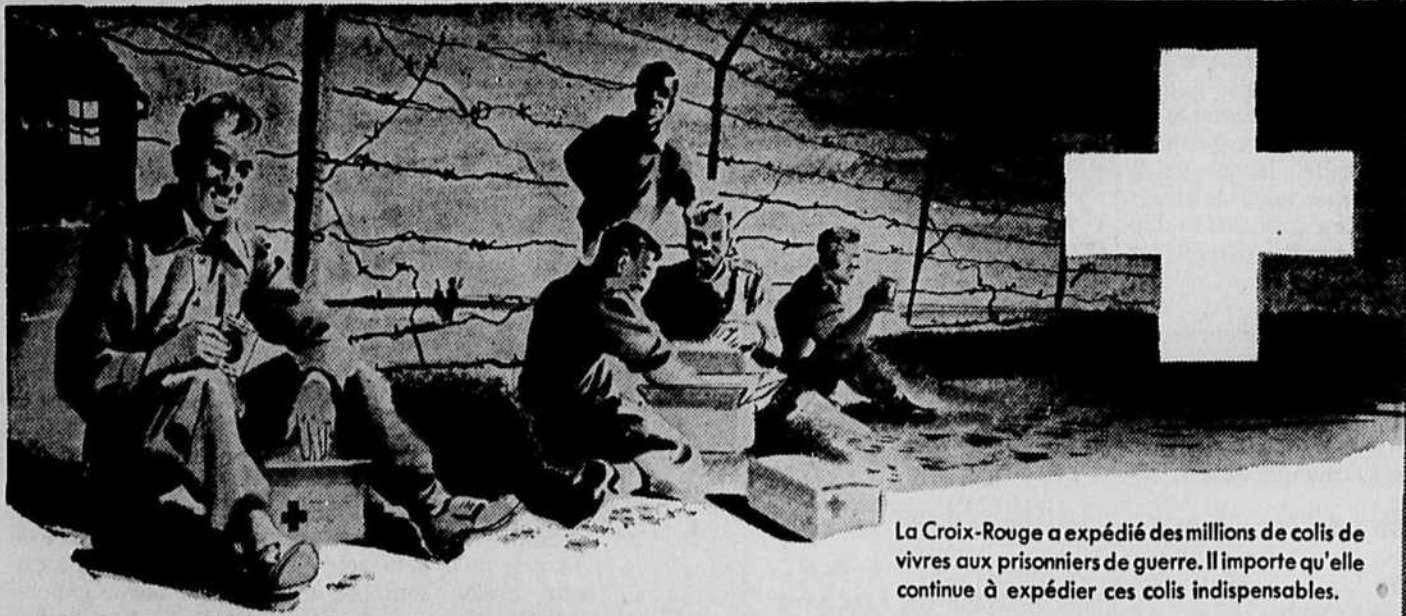
La Croix-Rouge a expédié des millions de colis de vivres aux prisonniers de guerre. Il importe qu'elle continue à expédier ces colis indispensables.