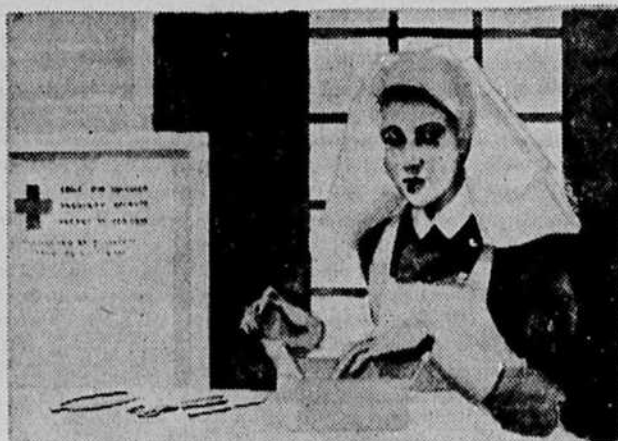
Il faut que les médicaments, les instruments de chirurgie et les pansements continuent d'affluer aux endroits où ils sont nécessaires. C'est le moment de souscrire afin de secourir nos gars outre-mer.