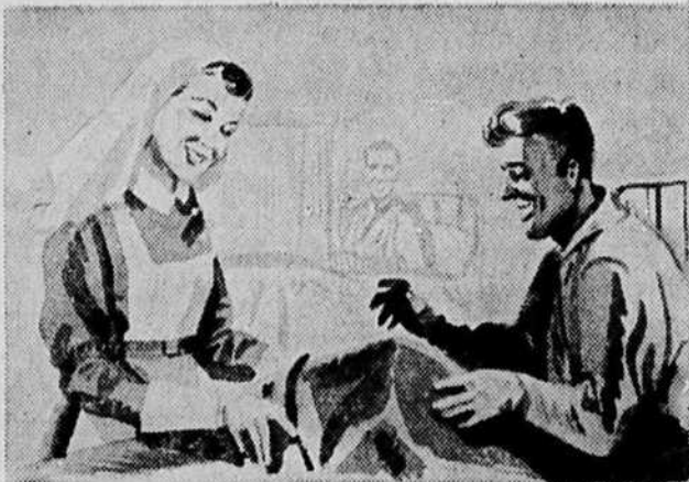
Les hôpitaux ont besoin de gardes-malades diplômées. Il faut aussi des ambulances et du matériel de toute sorte. Les infirmières de la Croix-Rouge, vraies soeurs de Charité qui soignent nos blessés, attendent de vous les moyens de poursuivre leur oeuvre humanitaire. Donnez généreusement.