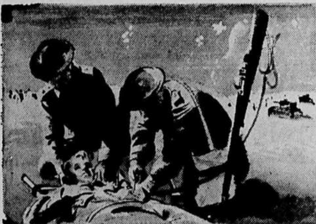
Le sérum sanguin est fait du sang des donateurs bénévoles, recueilli dans les cliniques de la Croix-Rouge. Ce sérum a déjà sauvé des milliers de vies humaines. Il faut de l'argent pour assurer le fonctionnement des cliniques.