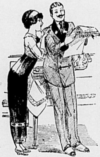
—Où irons-nous cette saison? A Cacouna? —Non, à Longueuil.