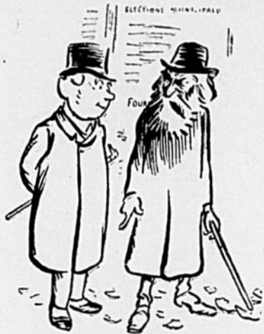
—Nos ministres, ce seraient des cochons si ce n'étaient pas des ânes!