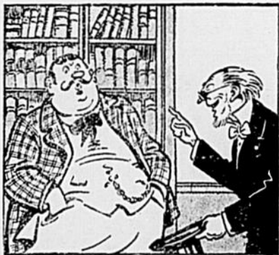
—Le pharmacien m'a vendu un remède épatant pour maigrir... —Et à moi, un pour engraisser... —C'est peut-être le même!...