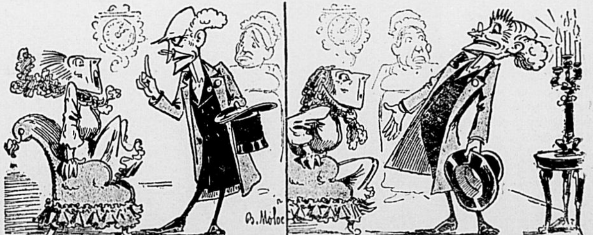
—Madame, ce que vous avez de mieux à faire à l'heure qu'il est, c'est d'envoyer chercher un notaire et un prêtre. —Docteur! Je suis perdue, je le vois bien!!! —Pas le moins du monde; mais je ne voudrais pas être le seul auquel on ait fait la farce, à 2 heures du matin, de le réveiller pour rien!