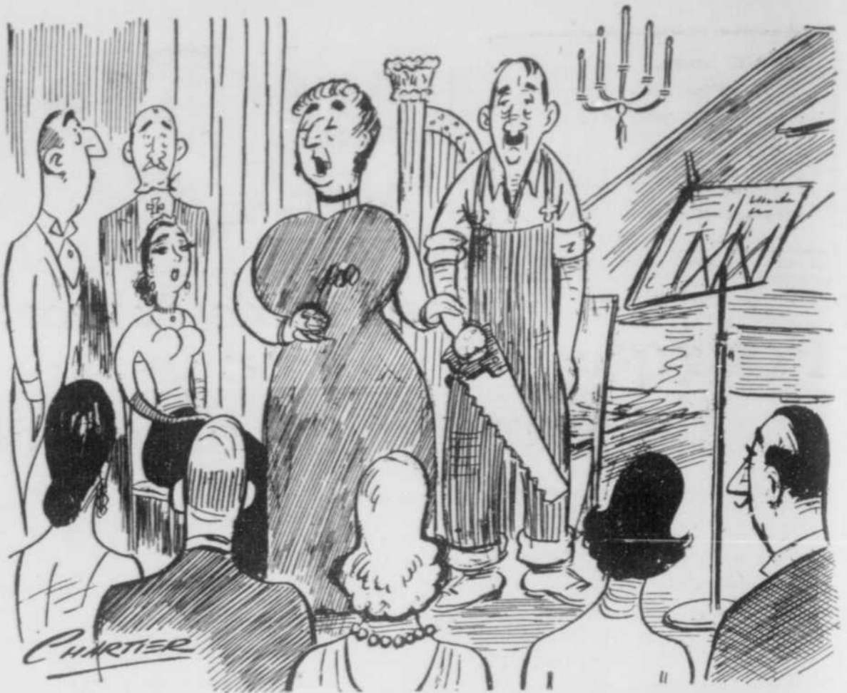
"Notre invité d'honneur, gagnant du Concours d'Amateurs "BORDEN" de la semaine dernière, nous interprète sur sa scie musicale: "La Chanson du Coeur Brisé".

Madame (Edouard) Bolduc est morte. La célèbre chanteuse populaire reçoit un hommage posthume d'Henri Letondal. L'ARCHIVISTE