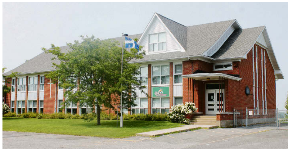
Les travaux de rénovation de l'école des Moissons ont débuté.

À ce jour, les forages du puits géothermique ont été réalisés, la façade de briques a été démolie en vue du futur agrandissement de la salle mécanique et le réservoir de mazout a été enlevé et la décontamination a été réalisée.