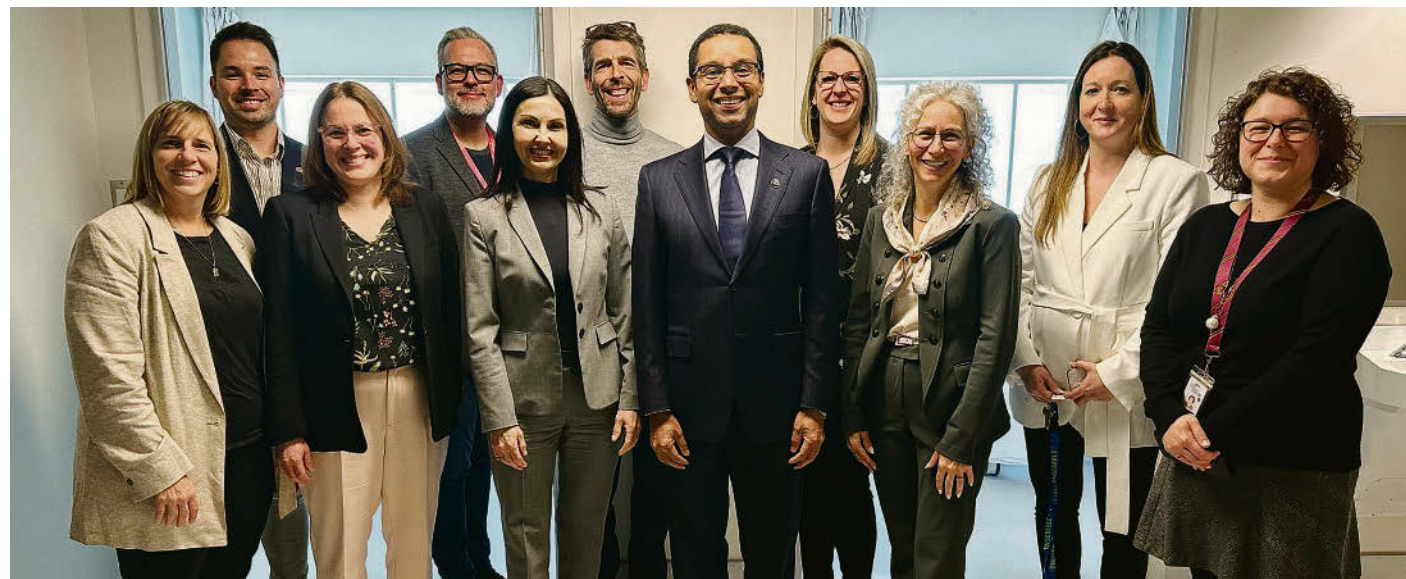
Plusieurs intervenants annonçaient la création d'une unité d'intervention brève (UIB) de deux lits à l'Hôpital Honoré-Mercier, dont Lionel Carmant, ministre responsable des Services sociaux, ici au centre.

Les jeunes en crise, qui nécessitent un suivi rapide en santé mentale, vivent majoritairement des crises suicidaires accompagnées de comportements autodestructeurs. Ceci peut se traduire par de graves problèmes d'automutilation ou des ruptures de fonctionnement majeures qui amènent un