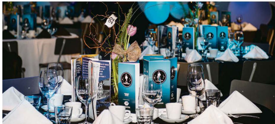
C'est 275 invités qui se sont attablés au Centre sportif d'Acton Vale, le 4 mai, pour le Gala Distinction.

Côté Expérience client , c'est le gymnase Le Temple (2022) avec ses 500 clients qui s'est démarqué. Dans la catégorie Réussir ensemble qui encourageait la collaboration entre les organismes et les commerces, c'est