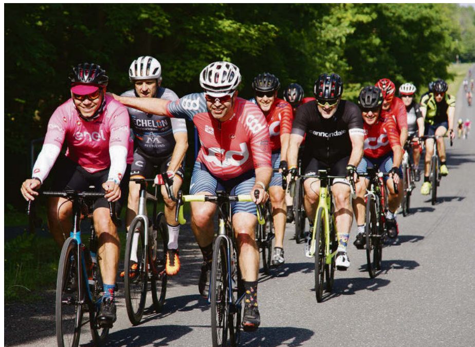
Le Défi cycliste en 2023.

Au programme de cette journée sportive et familiale, on trouve trois parcours auxquels les gens peuvent dès maintenant s'inscrire. Le parcours La balade gourmande est de 20 km et débutera à 10 h. Ce dernier est idéal pour les familles. La promenade récréative , quant à elle, est un parcours un peu plus exigeant de 50 km, dont le départ sera à 9 h 15. Finalement, le parcours La randon-