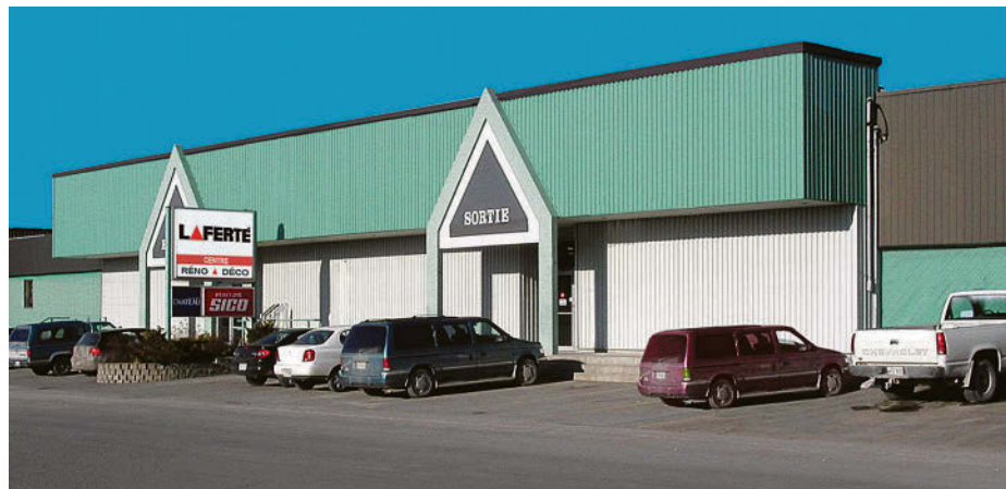
La succursale de la quincaillerie Laferté à Acton Vale.

Au sommet du classement établi par Protégez-vous se trouve la Quincaillerie G.H. Berger, suivie de Canac et de Laferté.