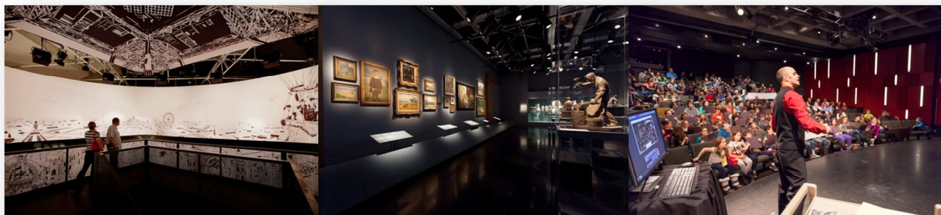
L'exposition Paris en scène. 1889-1914 accueille plus de 600 000 visiteurs

Les Musées ont bénéficié d'une contribution spéciale au cours de la dernière année, par l'intermédiaire de sa fondation. Le comité d'action tourisme de la Chambre de commerce et d'industrie de Québec a mis sur pied un fonds de mécénat dédié aux grandes expositions. L'exposition internationale Paris en scène a retenu l'attention des membres du comité par son pouvoir d'attraction auprès d'une clientèle touristique hors Québec et ses retombées économiques et touristiques prévisibles à Québec. Grâce aux cinq entreprises (Hôtel Château Laurier, Le Pain Béni, Les Tours du Vieux-Québec, Auberge Saint-Antoine et Chambre de commerce et d'industrie de Québec), la Fondation des Musées a pu soutenir de façon plus importante l'exposition-vedette présentée au Musée de la civilisation.