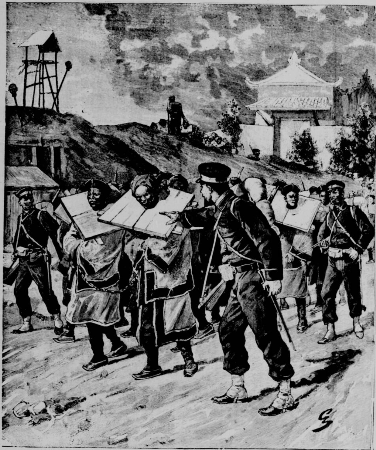
LA GUERRE ENTRE LA CHINE ET LE JAPON — CONVOI DE PRISONNIERS CHINOIS