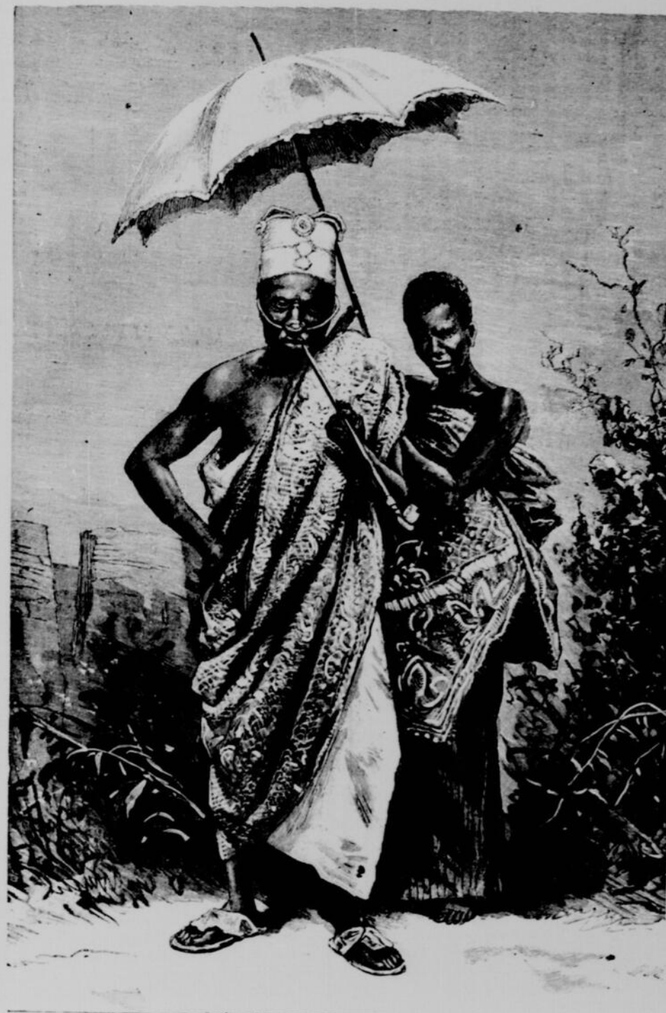
AGOLIAGBO, LE NOUVEAU ROI DU DAHOMEY