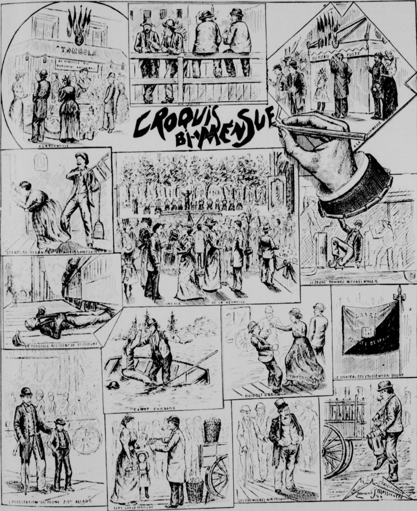
MONTRÉAL—PRINCIPAUX INCIDENTS DE LA QUINZAINE.—Dessin de Edmond-J. Massicotte

ANNONCES: La ligne, par insertion - - - - 10 cents Insertions subséquentes - - - - 5 cents Tarif spécial pour annonces à long terme