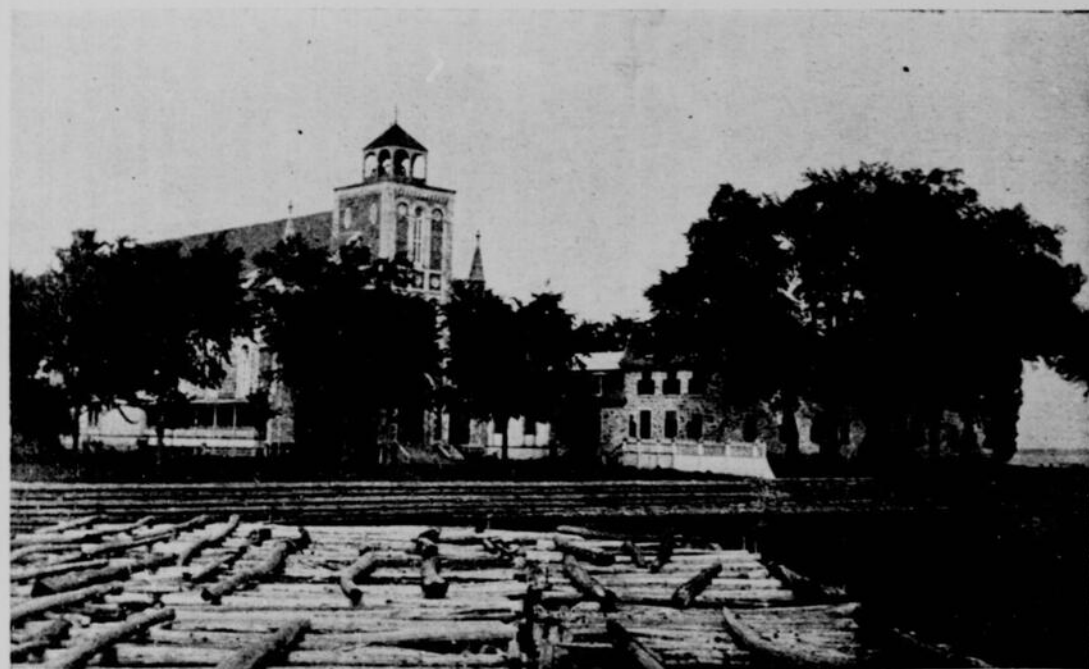
OKA.—ÉGLISE ET PRESBYTÈRE DES SULPICIENS