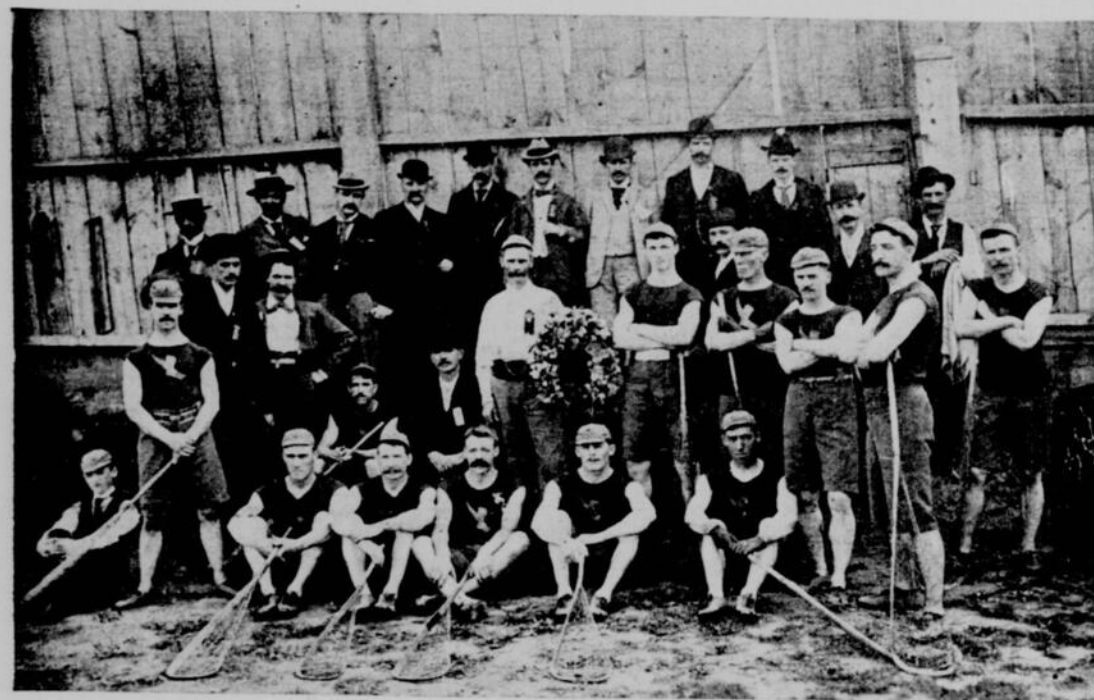
LE CLUB DES SHAMROCKS, CHAMPION DE LA SAISON 1894