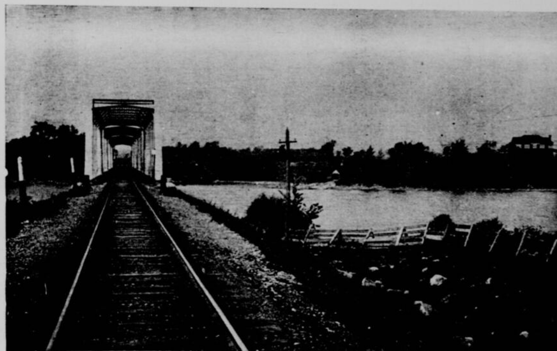
STE-ROSE.—PONT DU CHEMIN DE FER DU PACIFIQUE