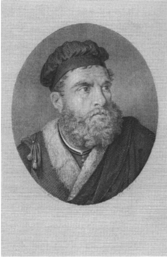
Portrait de Marco Polo, Musée Correr à Venise