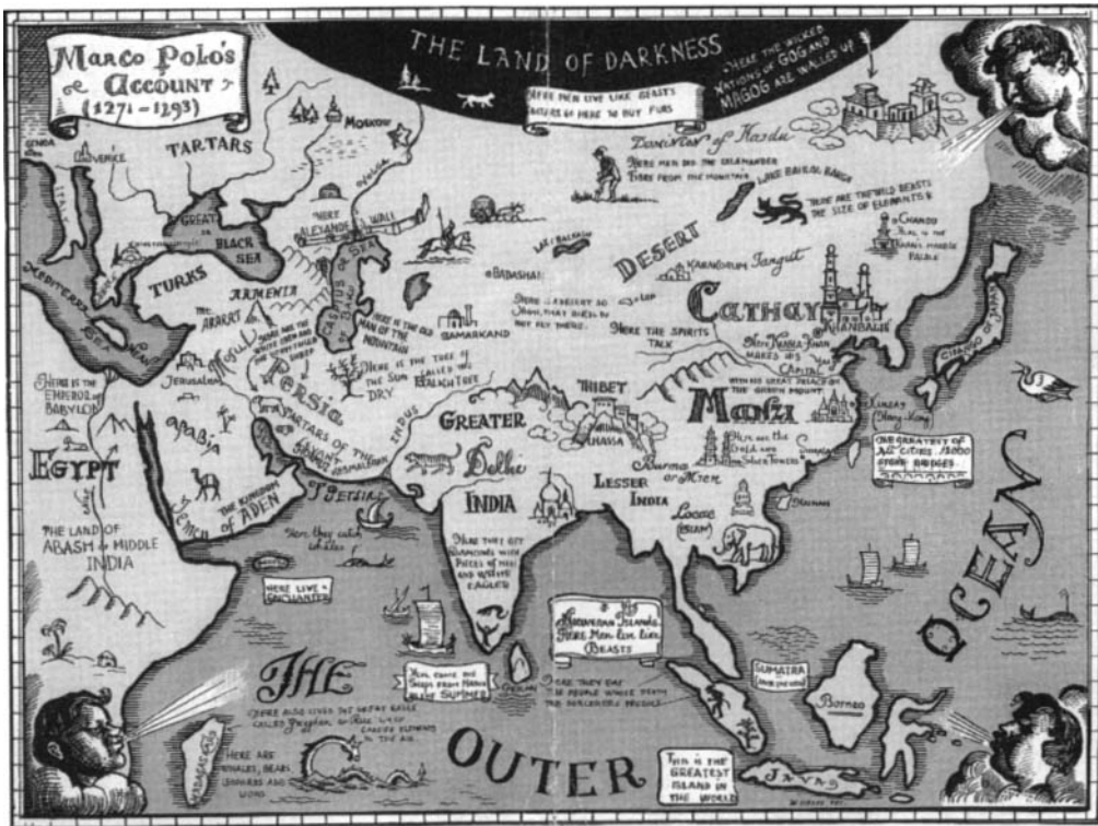
Carte des voyages de Marco Polo