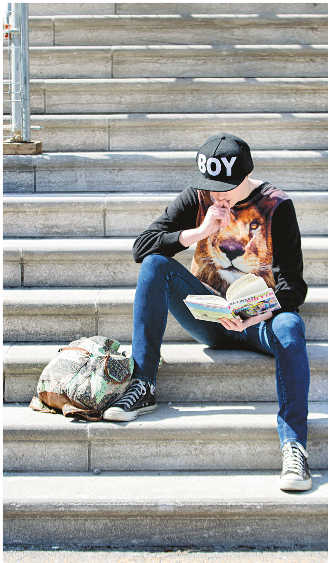
ANNIK MH DE CARUFEL LE DEVOIR

Au Québec, la Régie des rentes (RRQ) a mis son pied en 2011 un comité technique composé de la CSN, de la FTQ, de la Fédération des chambres de commerce du Québec, du Conseil