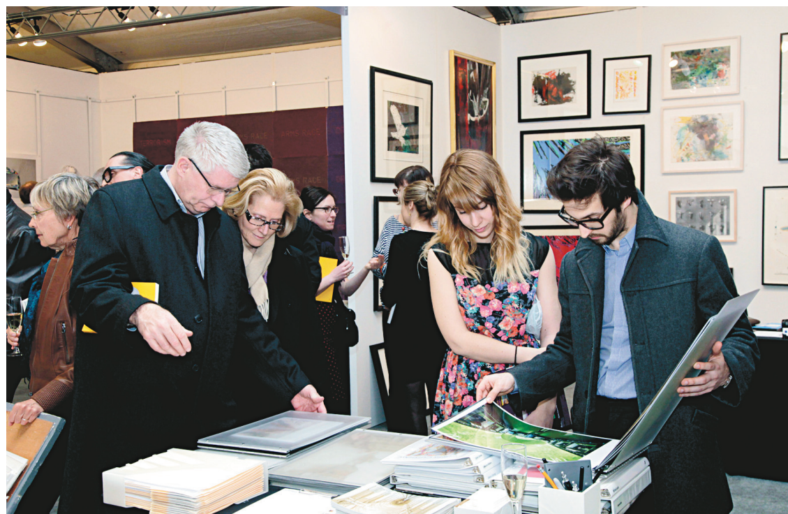
Amateurs d'art, fidèles et néophytes se donnent rendez-vous jusqu'à dimanche à la foire Papier 14.