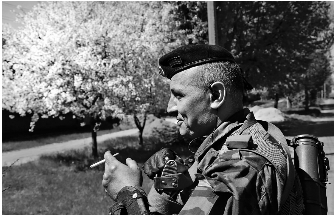
Pause printanière près de Sloviansk

«Le soutien de la Russie aux terroristes en Ukraine constitue un