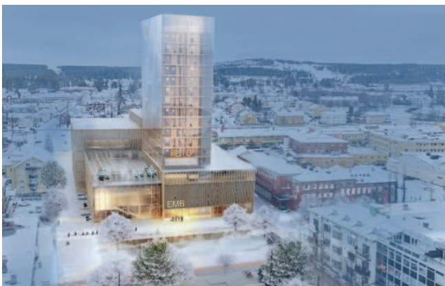
White Arkitekter / Kulturhus i Skellefteå, Suède.

Au-delà de son grand potentiel économique, l'industrie de la construction en bois constitue aujourd'hui un véritable écosystème socio-industriel auquel contribuent de façon coordonnée plus d'un millier d'entreprises québécoises, allant de l'exploitant forestier indépendant jusqu'au fabricant de bâtiments préfabriqués de grande hauteur, en passant par le secteur des matériaux biosourcés aujourd'hui exportés aux quatre coins de la planète. Au Québec, plus de 100 000 emplois directs et indirects sont liés à l'industrie de la transformation du bois. L'économie du bois fait littéralement vivre économiquement des centaines de communautés réparties sur l'ensemble du territoire québécois et participe activement à leur vie sociale.