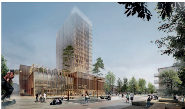
White Arkitekter / Kulturhus i Skellefteå, Suède.

En présence d'une foule de dignitaires de tous les milieux, aujourd'hui avait lieu, dans l'écoquartier d'Estimauville à Québec, l'inauguration très attendue du nouveau bâtiment de l'École des métiers du bois (EMB). Le bâtiment regroupera sous un même toit, à compter de septembre prochain, tous les programmes d'éducation professionnelle liés à la construction bois. Sous l'égide du ministère de l'Éducation et de l'Enseignement supérieur et du ministère des Forêts, de la Faune et des Parcs, en partenariat avec les principaux joueurs de l'industrie, le bâtiment de l'EMB servira également de centre de formation pour les gens de l'industrie d'ici et d'ailleurs, et ce, à l'année, l'EMB offrant des programmes de stage même en été. Depuis quelques années déjà, les facultés d'ingénierie et d'architecture du Québec imposent au moins trois cours obligatoires sur la conception de bâtiments de grande envergure en bois. Une tour de 22 niveaux entièrement en bois, une première au Québec, abritera les services administratifs, des bureaux pour les organismes partenaires, les résidences étudiantes et un service d'hôtellerie pour les visiteurs de l'extérieur.