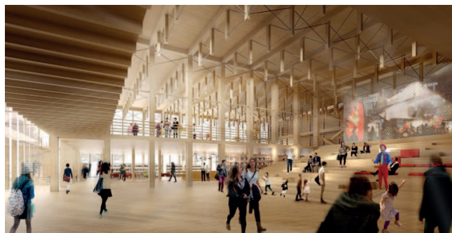
White Arkitekter / Kulturhus i Skellefteå, Suède.

Créée en 2019 sous l'initiative du ministère de l'Éducation et de l'Enseignement supérieur et du ministère des Forêts, de la Faune et des Parcs, en partenariat avec l'industrie, l'EMB a longtemps été un simple regroupement d'établissements d'enseignement qui s'assurait de la cohérence et de la coordination des programmes éducatifs liés à la construction en bois. L'explosion fulgurante de la demande, les avancées technologiques et la popularité des programmes a incité le gouvernement à lancer il y a cinq ans le projet inauguré aujourd'hui à Québec.