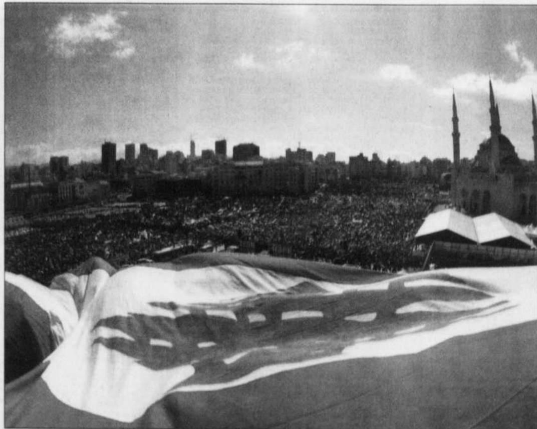
Les manifestants ont déployé un énorme drapeau du Liban, hier, à Beyrouth.

Le chef druze Walid Joumblatt, un des piliers de la coalition au pouvoir, a déclaré à la foule qu'il n'y aurait pour le Liban