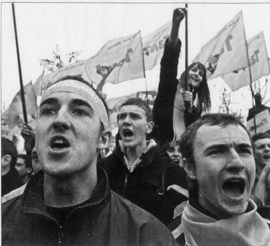
La Russie craint une contestation comme celle que l'Ukraine a connue l'an dernier.

Au même moment, un responsable de la Société d'amitié rus-