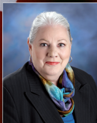
Charlotte L'Écuyer Députée de Pontiac