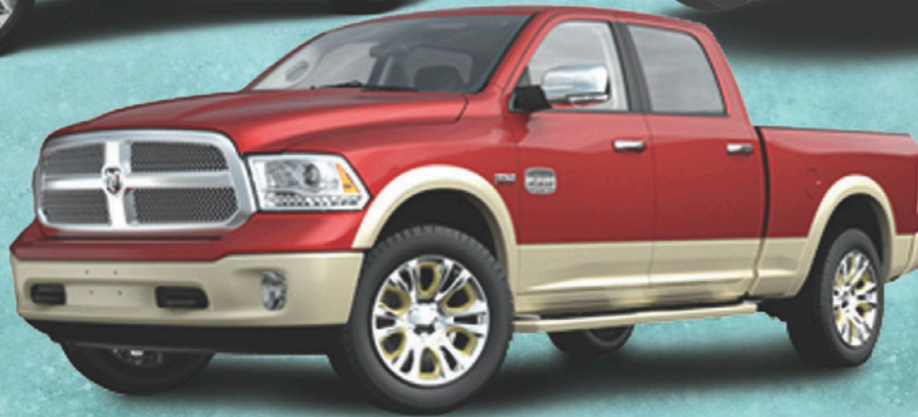
DODGE RAM 1500 2013