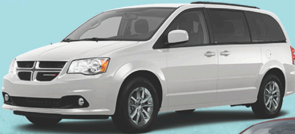
DODGE GRAND CARAVAN 2013