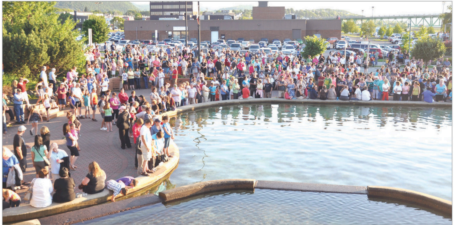
Plusieurs centaines de personnes étaient présentes lors de cette veillée à la chandelle qui s'est déroulée au Parc du Saumon à Campbellton.

Il a aussi adressé ces paroles aux parents de Connor et Noah: « Nous vou-