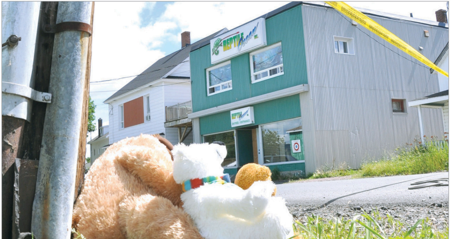
De petits ours ont été placés non loin de l'endroit où sont décédés les deux jeunes enfants de la région de Campbellton.