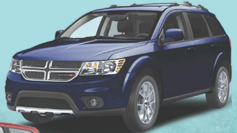
DODGE JOURNEY 2013