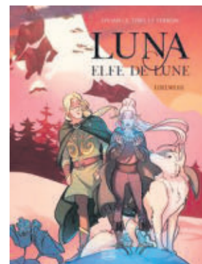
LUNA ELFE DE LUNE 2 EDELWEISS