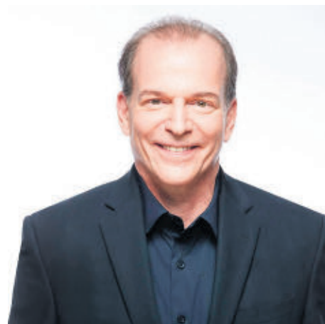
André Bachand, député de Richmond

Depuis le début de la pandémie, plusieurs organismes communautaires ont eu à intervenir en urgence auprès d'une population vulnérable, agissant au quotidien afin de préserver le filet social. Les CDC des Sources et du Val-Saint-François regroupent une centaine d'organismes à vocation sociale, dont plusieurs agissent en première ligne.