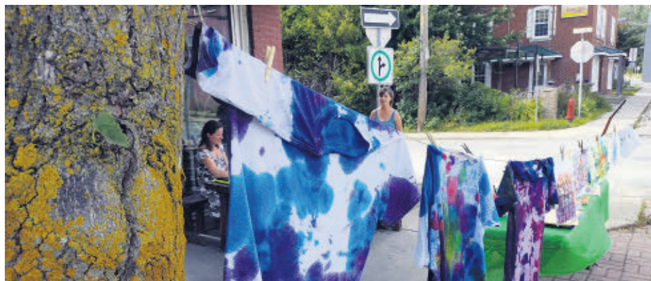
Plusieurs activités se sont déroulées à l'extérieur dont la Ruches d'art cet été à Richmond.

Le Rivage couvre l'ensemble des villes et des municipalités du territoire du Val-Saint-François, dont Richmond, Valcourt, Windsor, Melbourne, Ulverton et Stoke.