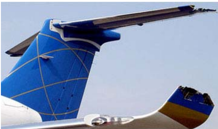
Aile du jet privé

Le destin nous réserve des bouleversements quotidiens et les catastrophes sont de plus en plus incroyables. La fusillade à Dawson, les deux viaducs à Laval et de nombreux accidents d'avion. L'écrasement