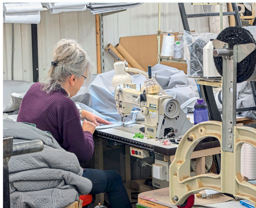
Le nombre d'employés pourrait éventuellement être amené à augmenter.