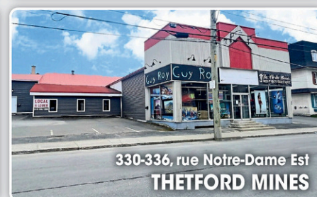
330-336, rue Notre-Dame Est THETFORD MINES

Votre projet immobilier mérite un professionnel d'expérience!