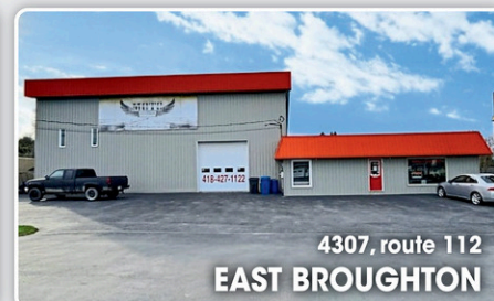
4307, route 112 EAST BROUGHTON