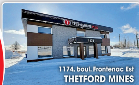
1174, boul. Frontenac Est THETFORD MINES