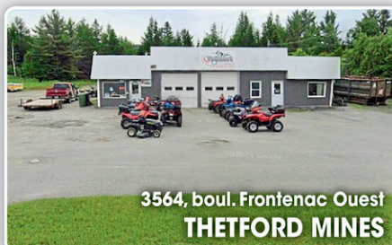
3564, boul. Frontenac Ouest THETFORD MINES