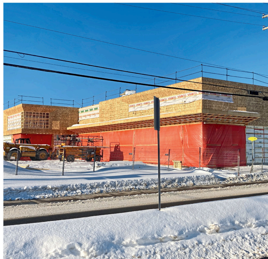
L'année 2024 a permis à la nouvelle Ville de Plessisville d'enregistrer des investissements pour une valeur déclarée des travaux de 50,3 millions $. Sur la photo, la Place Mia en construction.