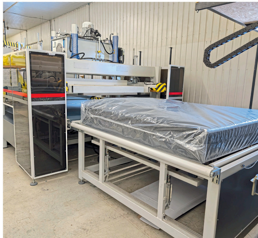
L'un des nouveaux équipements acquis pour améliorer les conditions de travail et la productivité.