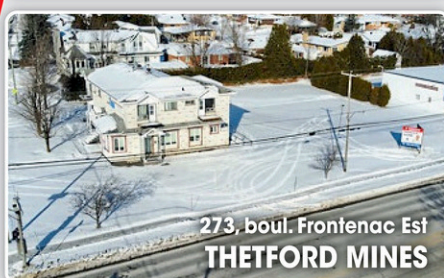
273, boul. Frontenac Est THETFORD MINES