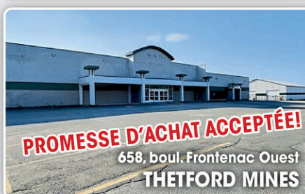
PROMESSE D'ACHAT ACCEPTÉE! 658, boul. Frontenac Ouest THETFORD MINES