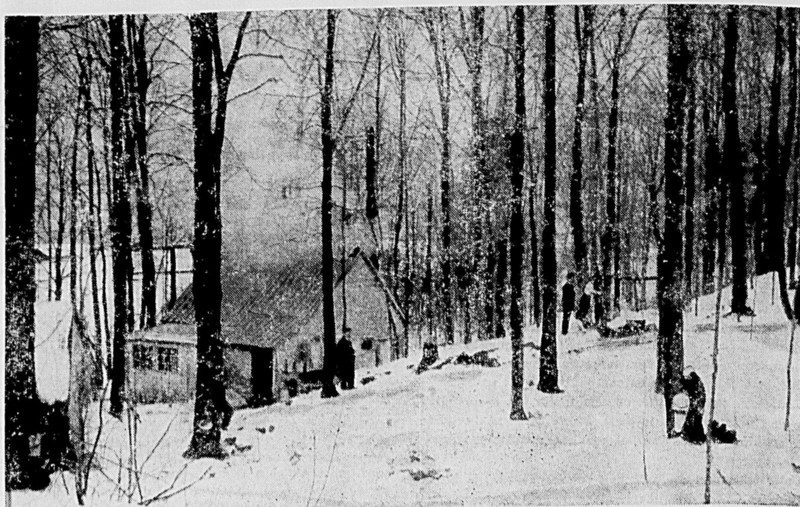
Le sirop d'érable du Québec est renommé dans le monde entier