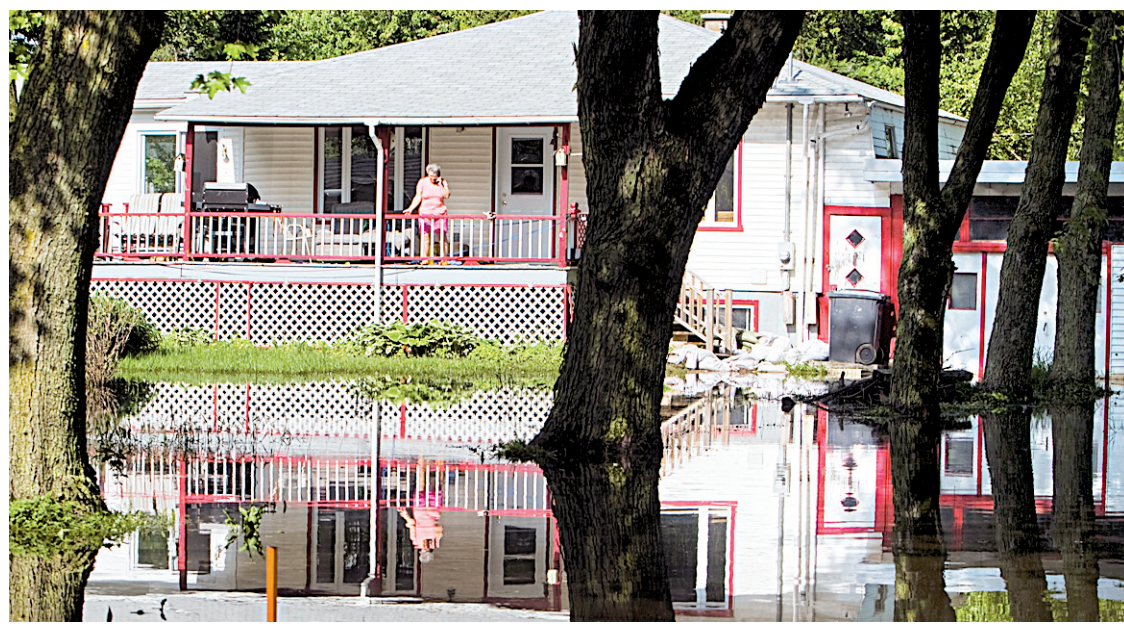
Une maison inondée en juin dernier, à Saint-Paul-de-l'Île-aux-Noix.

L'accès à l'urgence de l'Hôpital de Lachine sera limité jusqu'à lundi, en raison d'une inondation causée par le bris d'une conduite d'eau. Le Centre universitaire de santé McGill, auquel est rattaché l'hôpital, invite les résidents du secteur qui doivent se rendre à l'urgence à plutôt se tourner vers les autres établissements de soins de santé de Montréal. Aucune ambulance ne sera dirigée vers l'hôpital. — Le Devoir