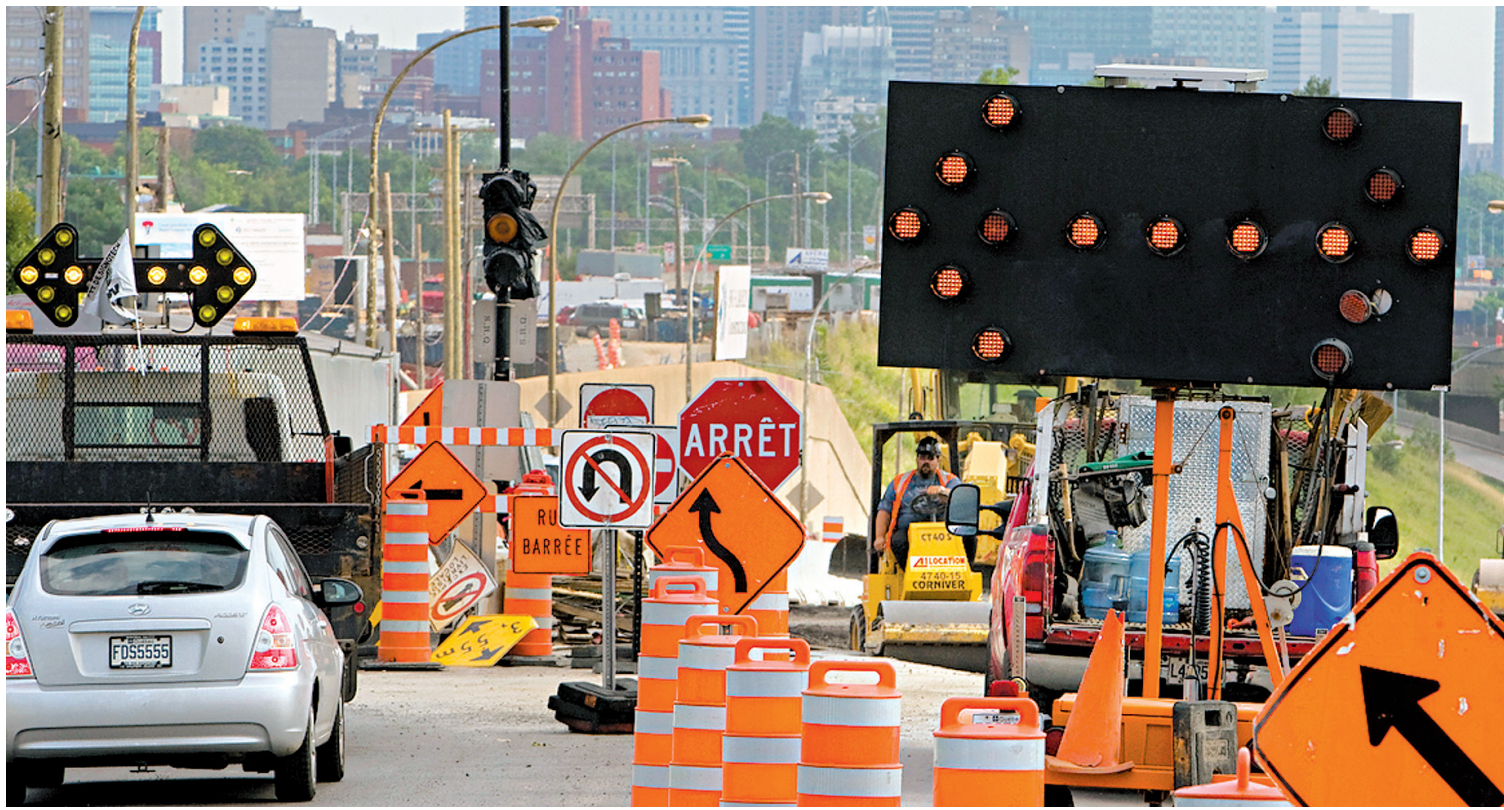
Il faudra attendre à la semaine prochaine pour connaître les mesures que Québec compte mettre en place pour soulager la congestion automobile dans la région de Montréal.