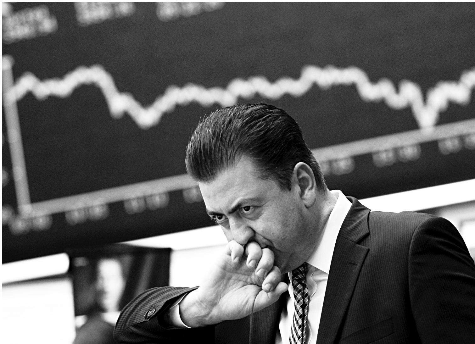
Un courtier observe les réactions des marchés à la Bourse de Francfort. Le secteur bancaire en Europe a écopé lourdement en Bourse: la Société Générale a chuté de 12 %, tandis que BNP Paribas est tombée de près de 7 %.