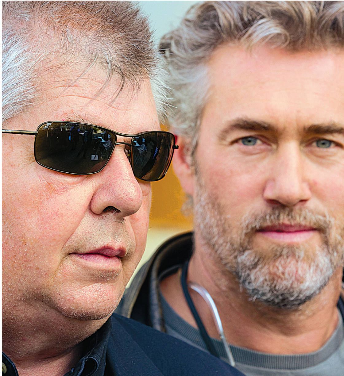
Le réalisateur André Forcier et Roy Dupuis, qui interprète dans Coteau rouge le rôle d'un vilain capitaliste.