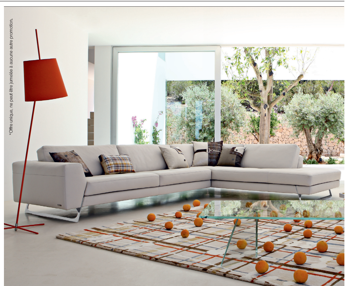
*Offre unique, ne peut être jumalée à aucune autre promotion.