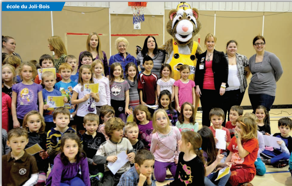
école du Joli-Bois