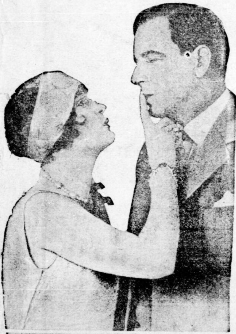
CETTE FOIS, C'EST REEL.—Milton Sills et Doris Kenyon ne sont pas ici pour le cinéma. Ces deux étoiles viennent de se marier.