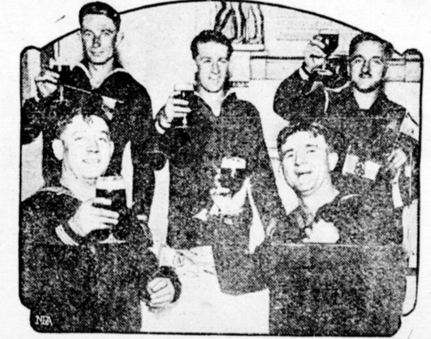
Voici un groupe de marins américains en visite dans la capitale d'Allemagne. Ils ont l'air de boire à la santé des prohibitionnistes des Etats-Unis.