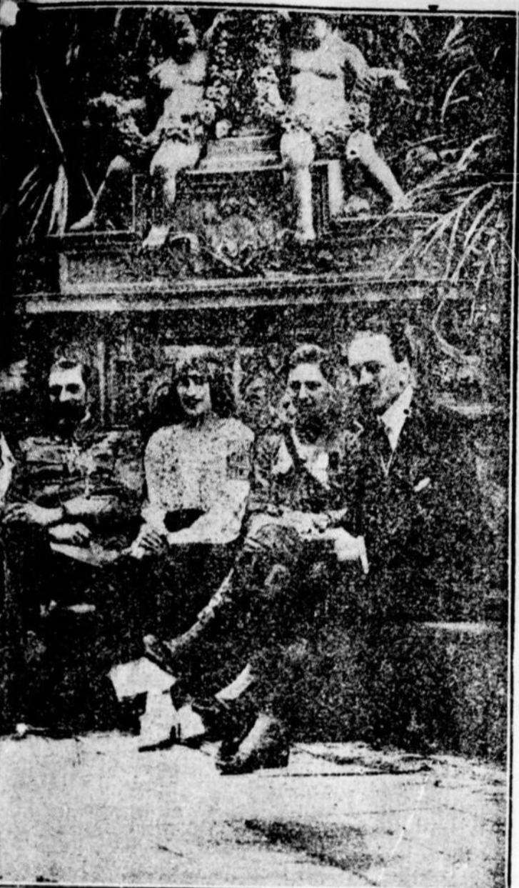
LA SINAIA.—Voici une photographie intéressante montrant le premier ministre de son pays, et la reine Marie de Roumanie...