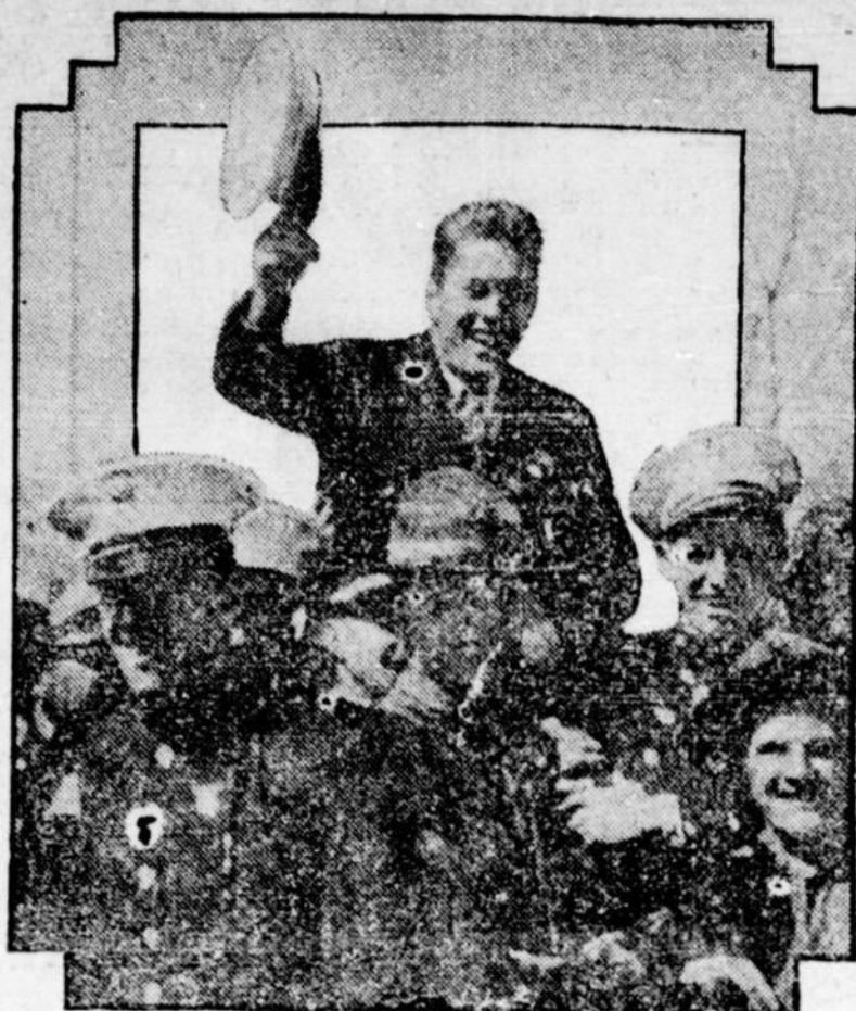
GENE TUNNEY.—Le nouveau champion des boxeurs du monde reçoit une ovation de ses anciens compagnons de la marine.