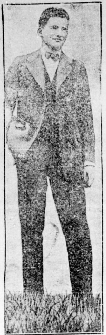
Un futur champion. Le connaissez-vous?