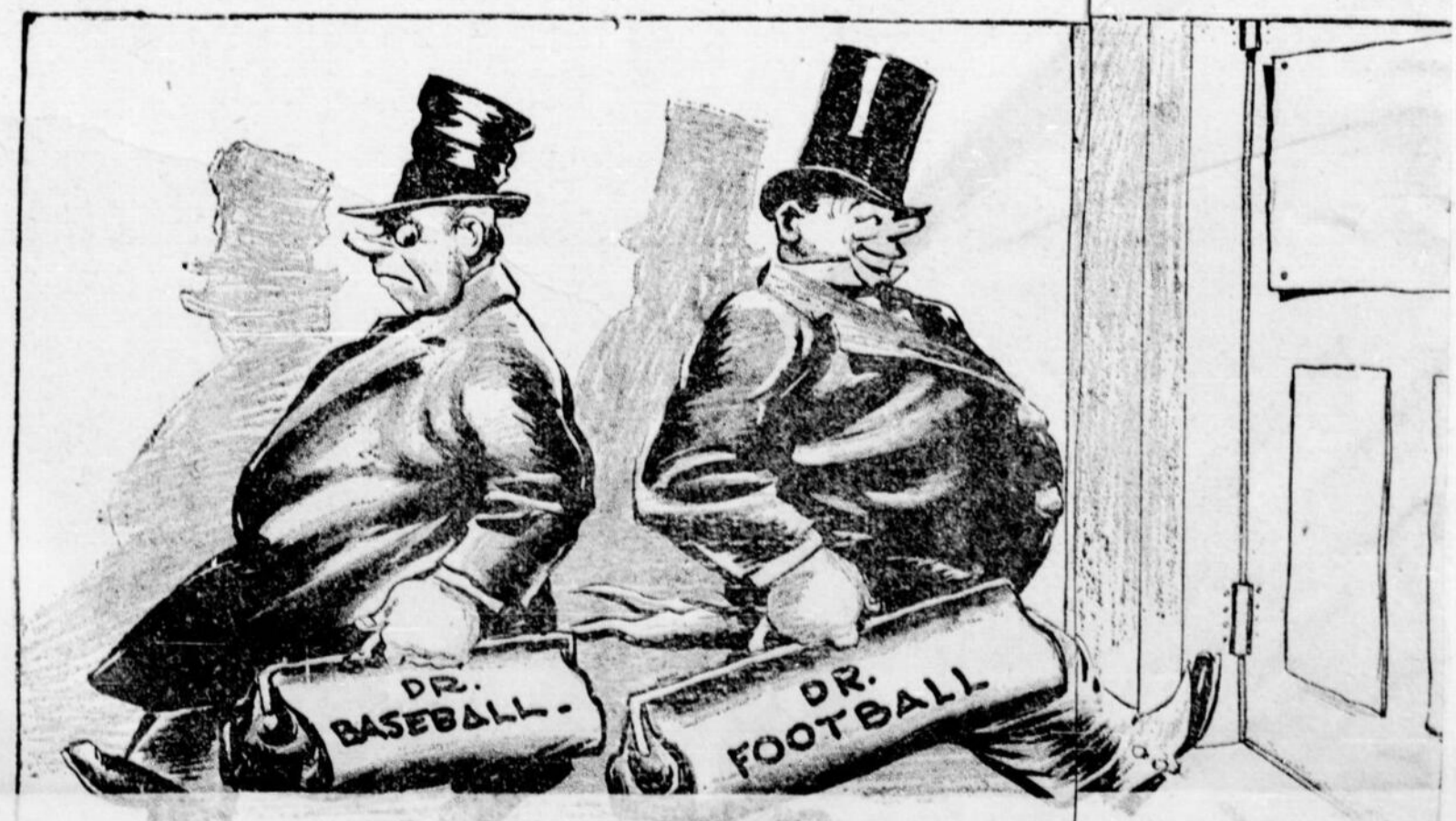
Le Dr. BASEBALL, le Dr. FOOTBALL, arrive, et le spécialiste HOCKEY surgira bientôt. Le Dr. HOCKEY a déjà plusieurs de ses collègues.