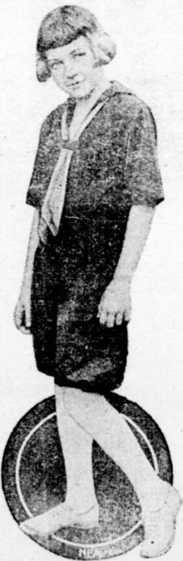
On lui refuse l'entrée des écoles dans ce costume.