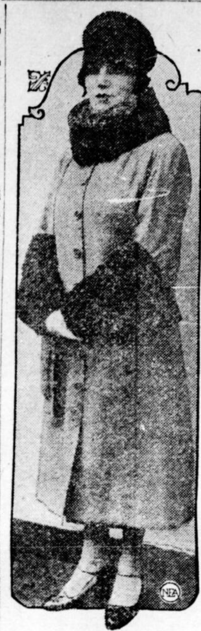
Ce qui va se porter beaucoup cet hiver en fait de manteau pour dames.