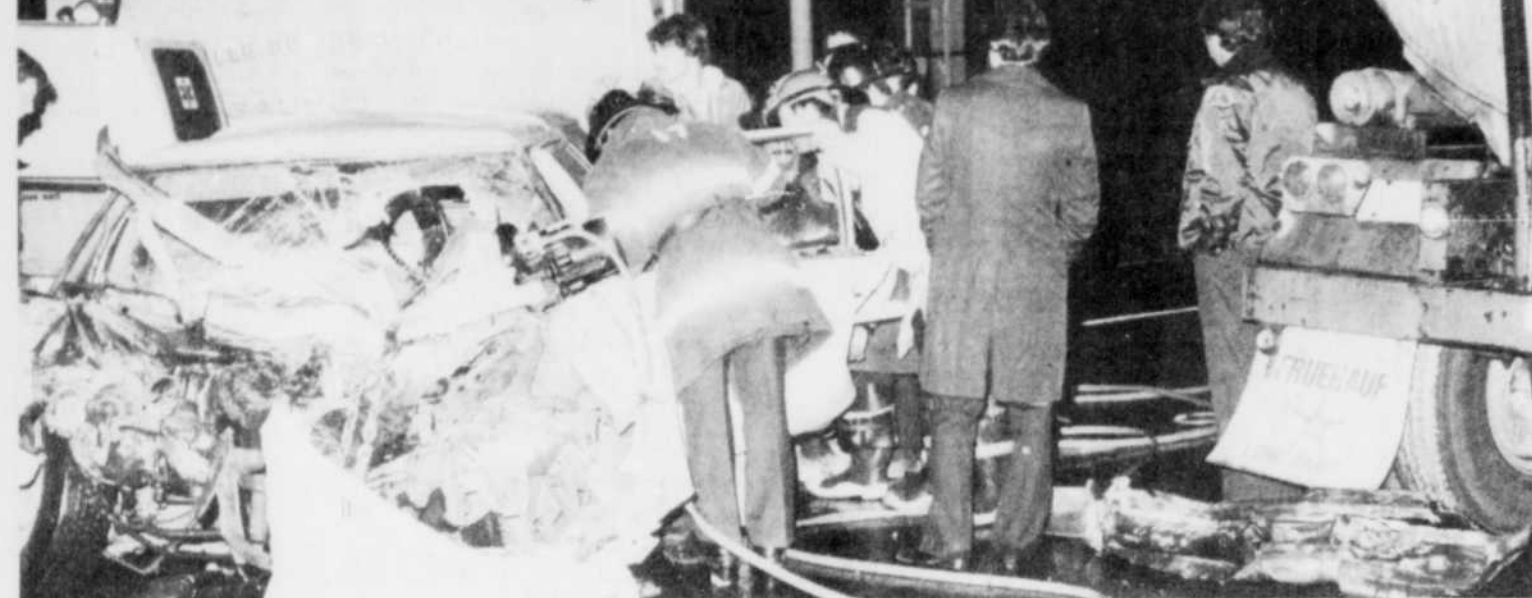
Les pompiers de Sherbrooke ont été appelés sur la scène d'un accident, au cours de la nuit de jeudi à vendredi, sur le chemin des Ecoissais. Dans la collision impliquant une familiale et un camion-citerne, l'automobiliste était resté coincé.