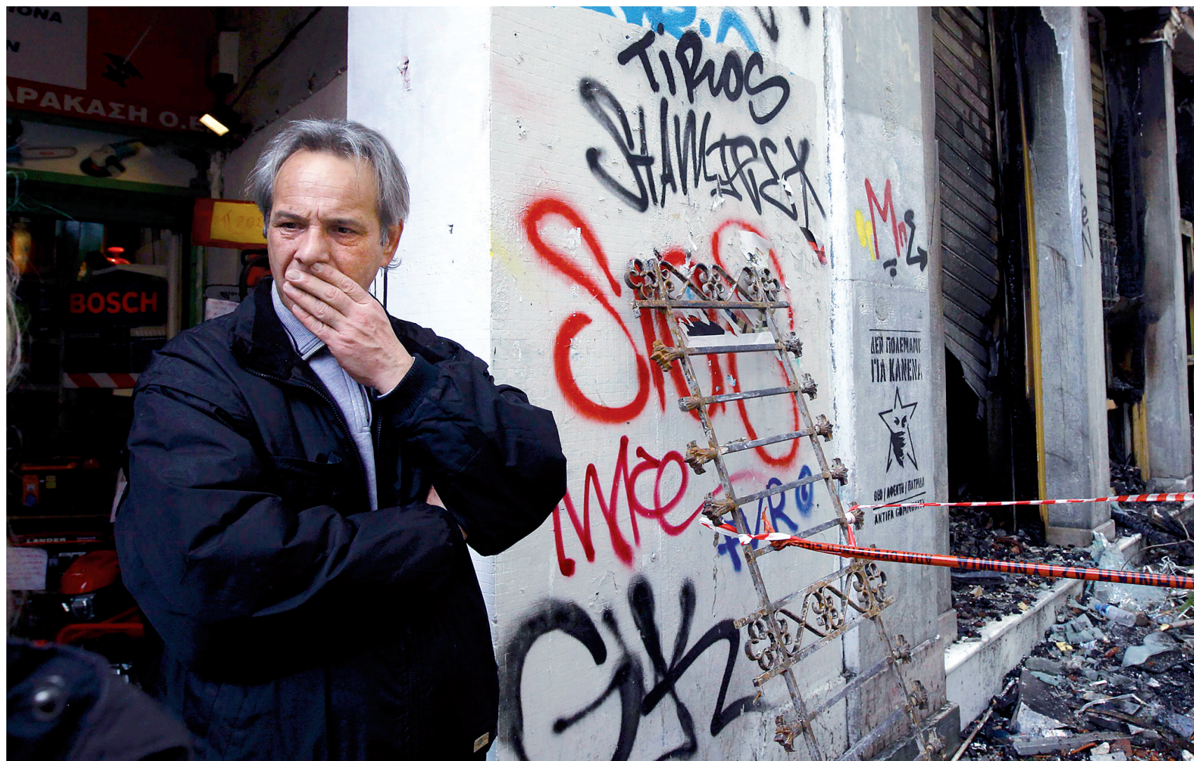
À Athènes, le propriétaire d'un commerce constate les dégâts causés par les émeutiers. Mais il n'y a pas qu'à Athènes que la réponse européenne à la crise de la dette suscite du mécontentement. « Trop, c'est trop », scande la Confédération européenne des syndicats, jugeant que la rigueur imposée est désormais insoutenable.