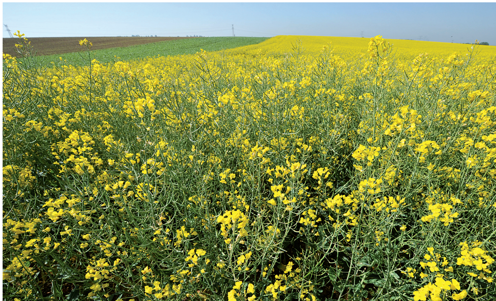
Un champ de canola dont Monsanto commercialise, entre autres produits, des semences génétiquement modifiées.

Vous pouvez aussi suivre notre journaliste sur Twitter (@FabienDeglise) ainsi que sur Google+ (Fabien Deglise).