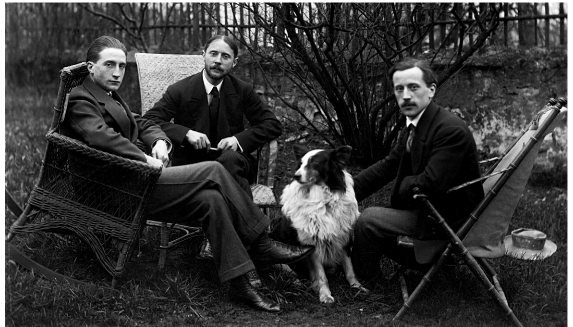
Marcel Duchamp, Jacques Villon et Raymond Duchamp-Villon dans le jardin de l'atelier de Puteaux. La photographie aurait été prise vers 1912-1913.

En rassemblant une quinzaine de toiles de cette période, dont plusieurs revenues des États-Unis pour l'occasion, l'exposition replace Villon au premier plan de cette histoire. Sa Jeune fille de 1912 n'est pas moins découpée en trapèzes et triangles que le Nu descendant l'escalier et y ajou-