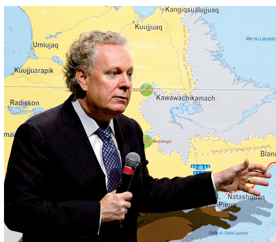
Le premier ministre Jean Charest