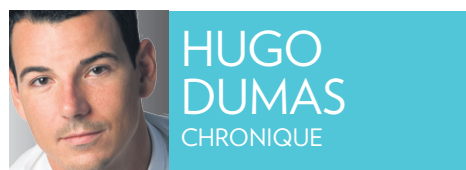
HUGO DUMAS CHRONIQUE

À lire les courriels fielleux qui déboulent dans ma boîte depuis une semaine, la couverture télé de V et RDS des Jeux olympiques de Vancouver ne vous épate pas du tout.