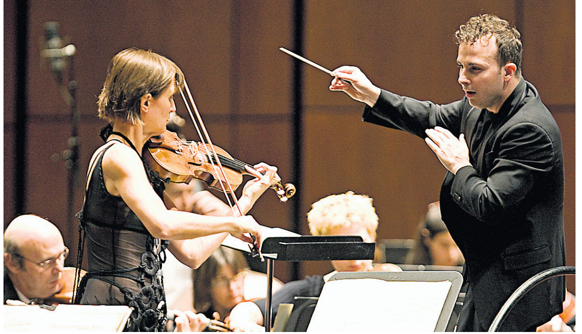
La violoniste Viktoria Mullova, dirigée par Yannick Nézet-Séguin.

Oublié aussi, le Concerto pour violon de Brahms qui ouvrirait la soirée. Très grande, très droite et toujours aussi impassible, Viktoria Mullova possède encore une technique fort respectable, sinon par-