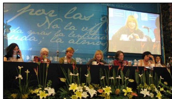
Sesión « Mujeres y seguridad en los espacios urbanos », organizada por UNIFEM y ONU-HABITAT, 14 de noviembre de 2008, Querétaro

Al final del coloquio, 75 participantes respondieron al cuestionario de evaluación (tan sólo el 11% entre ellos eran miembros del CIPC), del cual presentamos a continuación los resultados generales: