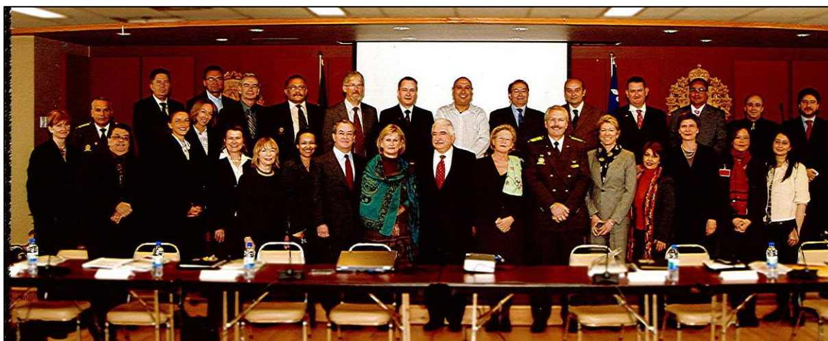
Reunión del CCO, 1 y 2 de mayo de 2008, en las oficinas de la Sûreté du Québec en Montreal.

En el momento de impresión del informe de actividades de 2008, el estado financiero del CIPC para el 2008 aún no se encontraba disponible. Sin embargo, en términos generales, el presupuesto del CIPC confirma una tendencia al alza en los últimos tres años, pasando de 1.499.967$ en 2006 a 1.739.230$ en 2007 y a 1.859.966$ en 2008 (según el presupuesto establecido al 30 de septiembre de 2008), lo que equivale a un incremento de los ingresos cercano al 25% en 2 años.