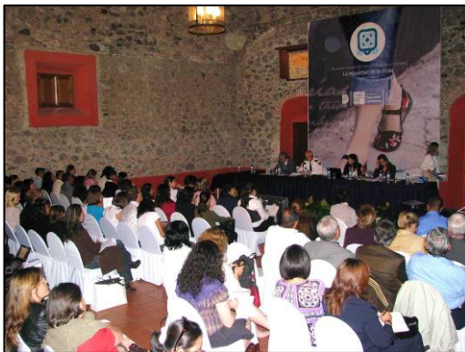
Taller sobre el papel de los hombres en la seguridad de las mujeres, Querétaro

En los talleres participaron reconocidos expertos provenientes de gobiernos, instituciones policiales, organizaciones internacionales, organizaciones no gubernamentales, universidades y centros de investigación.