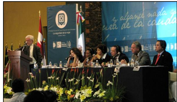
Foro de ciudades, 14 de noviembre de 2008, Querétaro

organizaciones acerca de la seguridad de las mujeres.