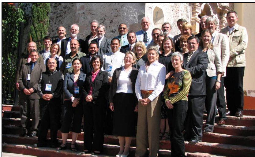
Miembros y equipo del CIPC presente durante las Reuniones de gobierno, 10 y 11 de noviembre de 2008, Querétaro, México

El CIPC realizó su Asamblea general anual y la reunión del Consejo de administración el 10 y 11 de noviembre de 2008 en Querétaro, México. En las reuniones participaron 29 miembros, además de los 7 administradores presentes y 5 administradores representados por procuración.