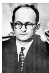
Adolf Eichmann l'ors de sa condamnation à mort