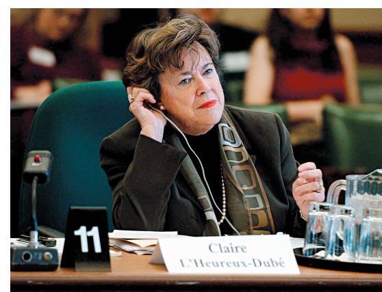
Claire L'Heureux-Dubé, ancienne juge de la Cour suprême du Canada.

L'actrice Barbara Sukowa dans le rôle de la philosophe Hannah Arendt couvrant le procès du nazi Adolf Eichmann, à Jérusalem, en 1961.