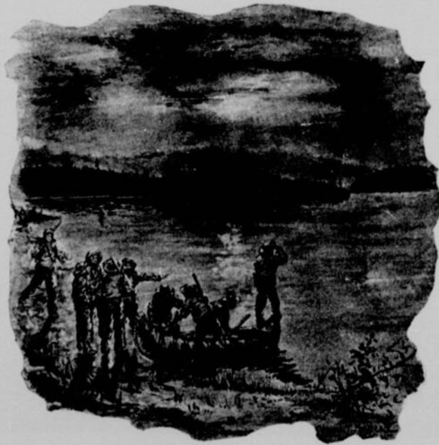
Les plus jeunes et les plus habiles prirent place dans un canot d'écorce