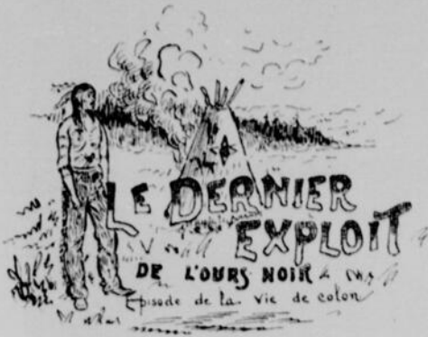
(Illustrations de Edmund-J. Massicotte)

Le double d'hommes qu'il fallait étaient réunis sur le bord du lac. Les plus jeunes et les plus habiles furent choisis et prirent place dans un large canot d'écorce. Ceux qui restaient leur souhaitèrent bonne chance, et les regardèrent s'éloigner jusqu'à ce qu'ils fussent perdus dans l'obscurité.