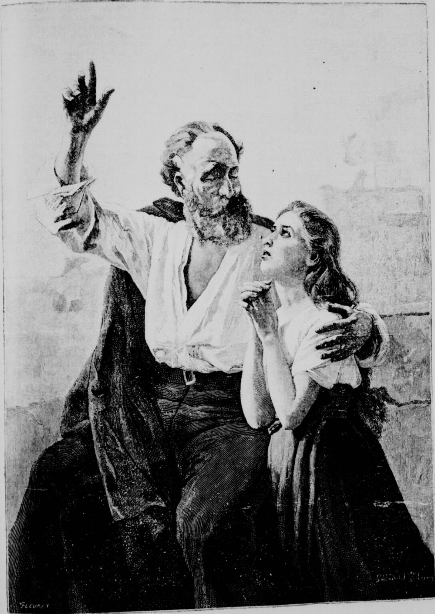
BEAUX-ARTS — MIGNON ET LOTHARIO, TABLEAU DE M. SERENDAT DE BELZIM

La ligne, par insertion - - - - 10 cents Insertions subséquentes - - - - 5 cents Tarif spécial pour annonces à long terme