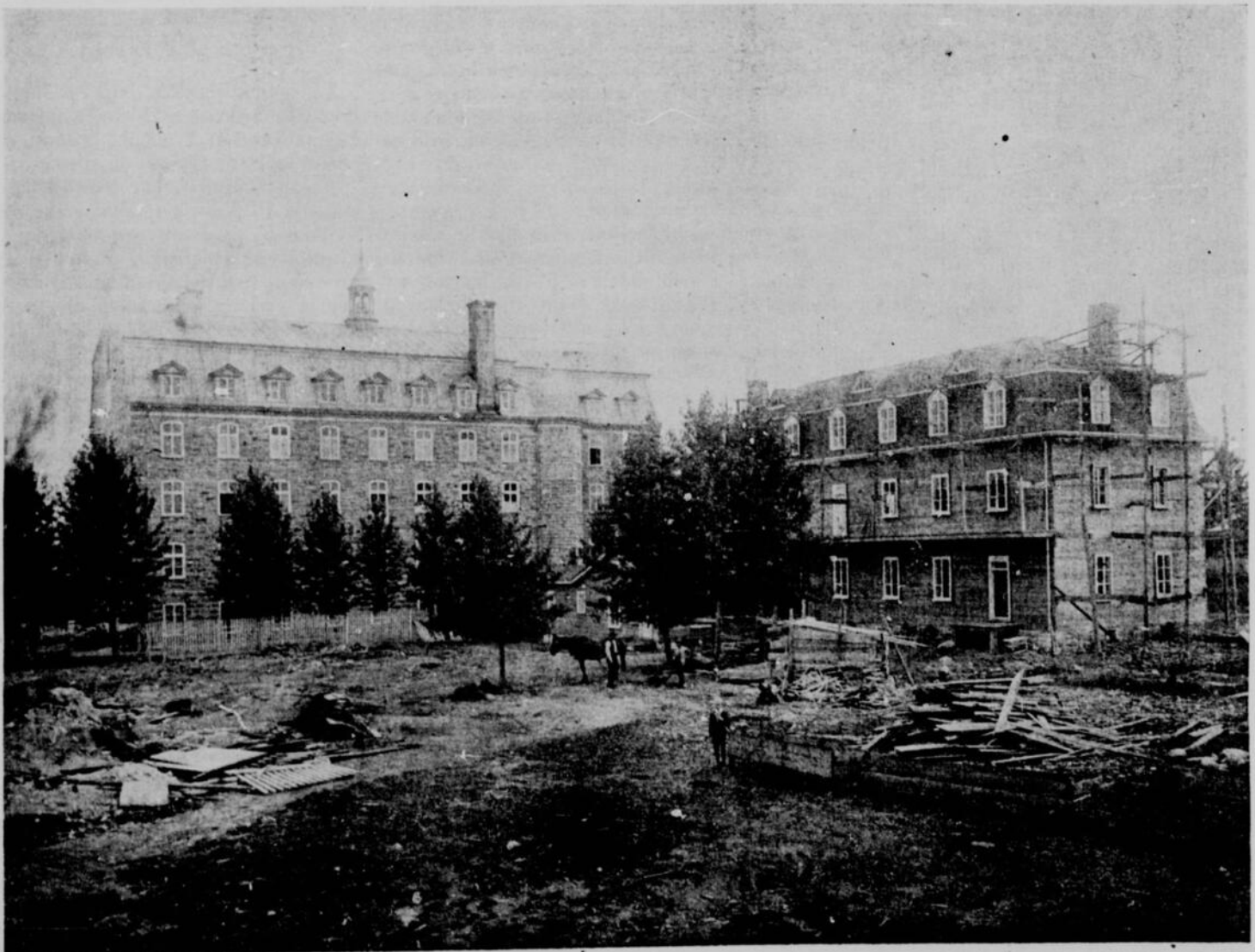
LAC SAINT-JEAN.—ÉCOLE MÉNAGÈRE AGRICOLE : COUVENT DES URSULINES A ROBERVAL.—Photo. Livernois, Québec