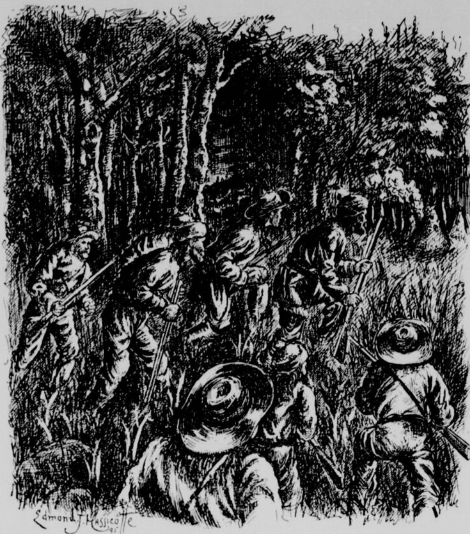
LE DERNIER EXPLOIT DE L'OURS-NOIR. — Il indiqua silencieusement une clairière. — Page 620, col. 2