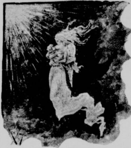
Dessin de René Sempard.

bras un petit corps pâle comme un lys sous ses habits blancs.