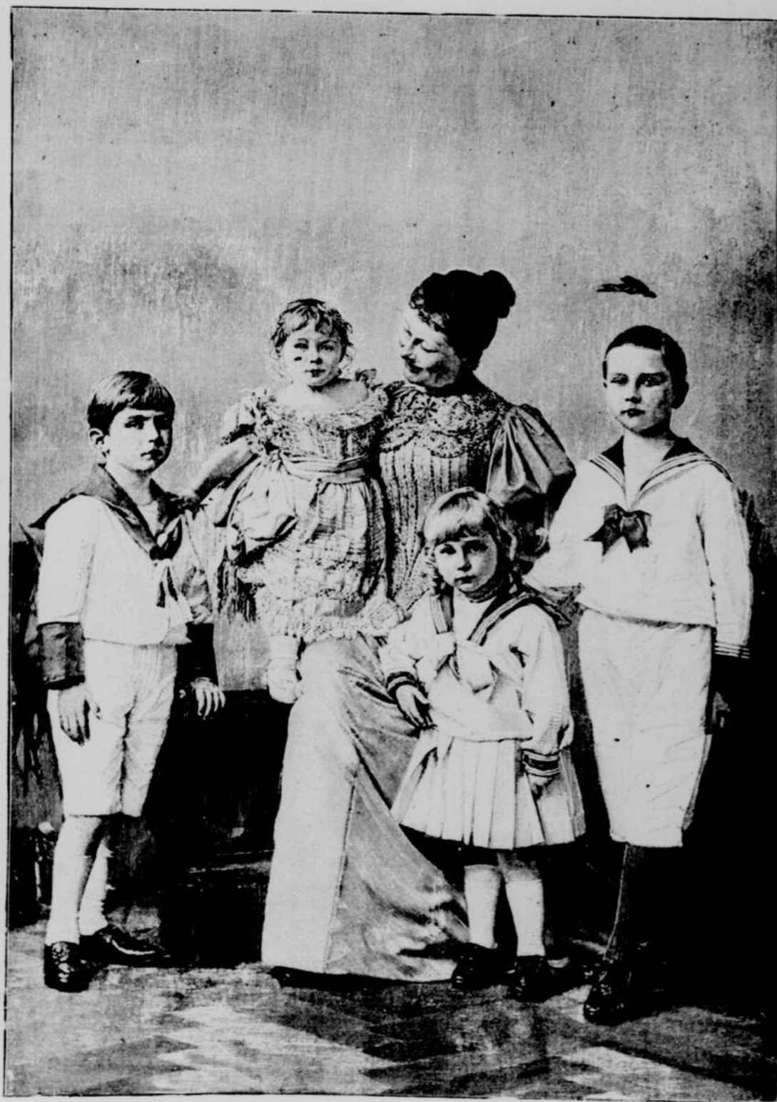
L'IMPÉRATRICE D'ALLEMAGNE ET SES PLUS JEUNES ENFANTS