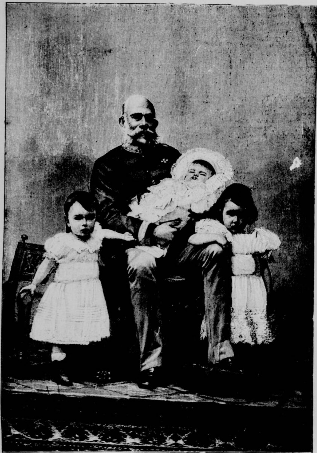
L'EMPEREUR D'AUTRICHE ET SES PLUS JEUNES PETITS-ENFANTS