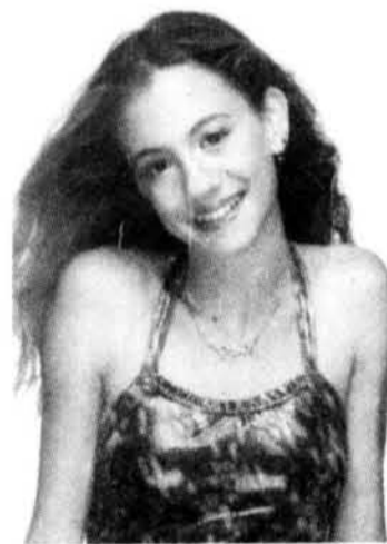
Invitée spéciale : Jennifer qui personnifiait «Mel-C» des «Spice Girls» (Première partie du spectacle à 12h30)