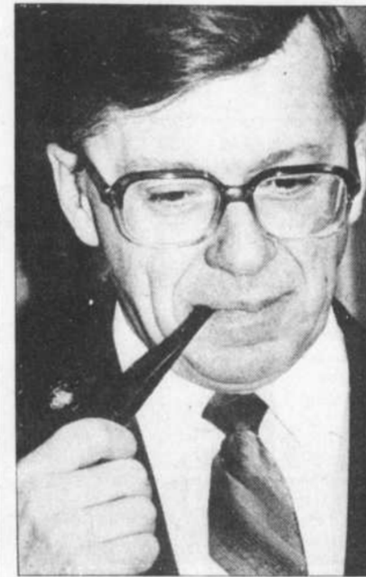
Le chef intérimaire du Parti libéral du Québec, M. Gérard D. Lévesque, au conseil général de son parti, hier à Montréal.

Le chef intérimaire du Parti libéral du Québec, M. Gérard-D. Lévesque, a prévenu hier les libéraux fédéraux qu'il n'appartient pas au Sénat canadien de décider de l'avenir de la Caisse de dépôt et placement.