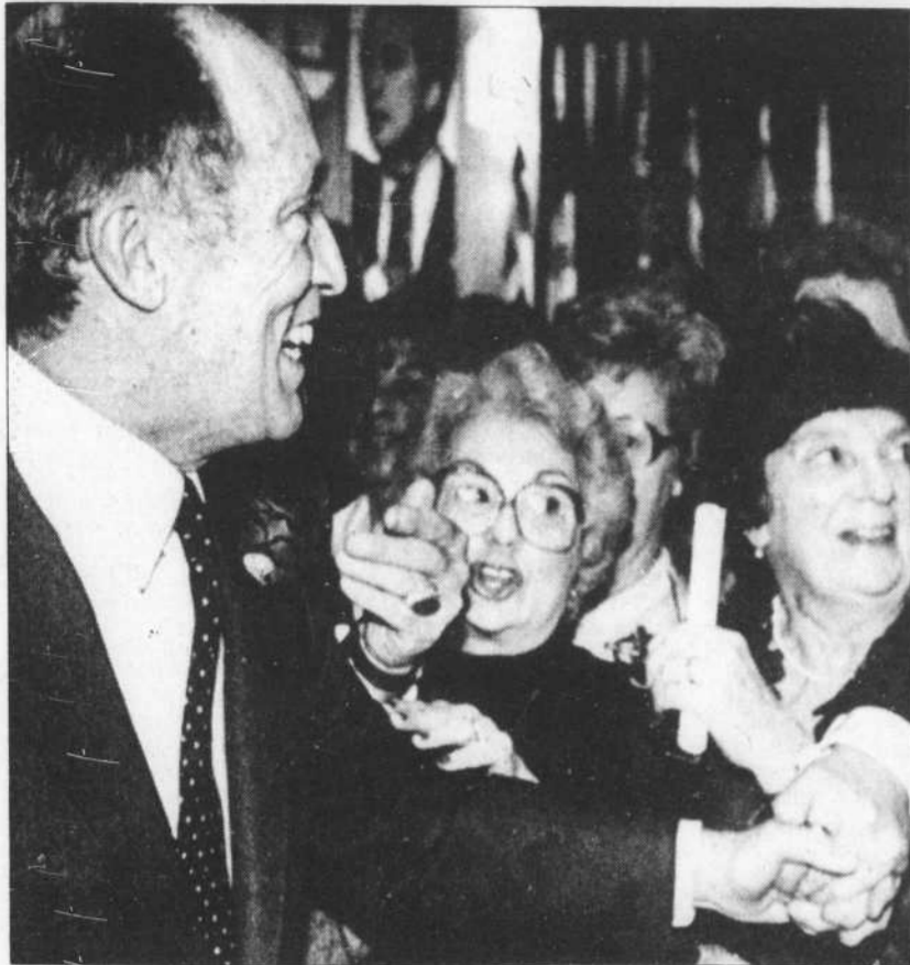
Le premier ministre Trudeau était le centre d'attraction, hier à Montréal, au brunch-bénéfice auquel 2.200 personnes ont pris part.