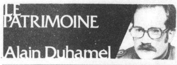
LE PATRIMOINE Alain Duhamel

VERS la fin de l'été dernier, le ministre des Transports du Québec a annoncé la démolition du manoir Dumontier, à Sainte-Anne-d'Yamachiche, dans le but d'aménager l'intersection de deux routes.