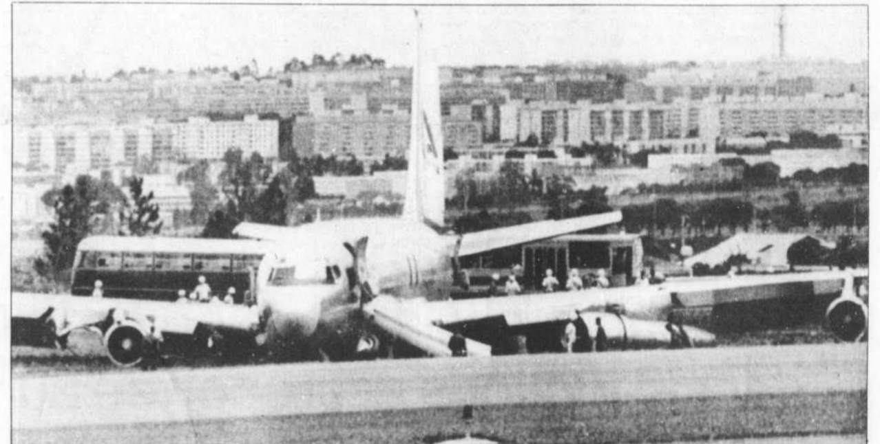
Un Boeing 707 de la compagnie américaine Global Airlines, transportant 60 passagers dont 45 journalistes des chaînes américaines de télévision qui avaient couvert la visite officielle du président Reagan au Brésil, a dû faire un atterrissage d'urgence, samedi, sur l'aéroport international de Brasilia, en raison d'une défaillance mécanique. L'avion n'ayant pu prendre rapidement de l'altitude, le train d'atterrissage a frappé l'un des pylones d'éclairage de la piste. Le train d'atterrissage gauche a été arraché et deux pneus ont été crevés. Personne n'a été blessé dans l'incident.