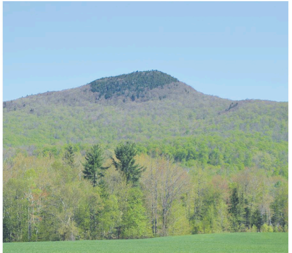
The circuit takes you from Saint-Armand through Frelighsburg with its fabulous view of Mount Pinnacle.

For an interactive map and information on the artists go to www.leboulevarddesarts.com .