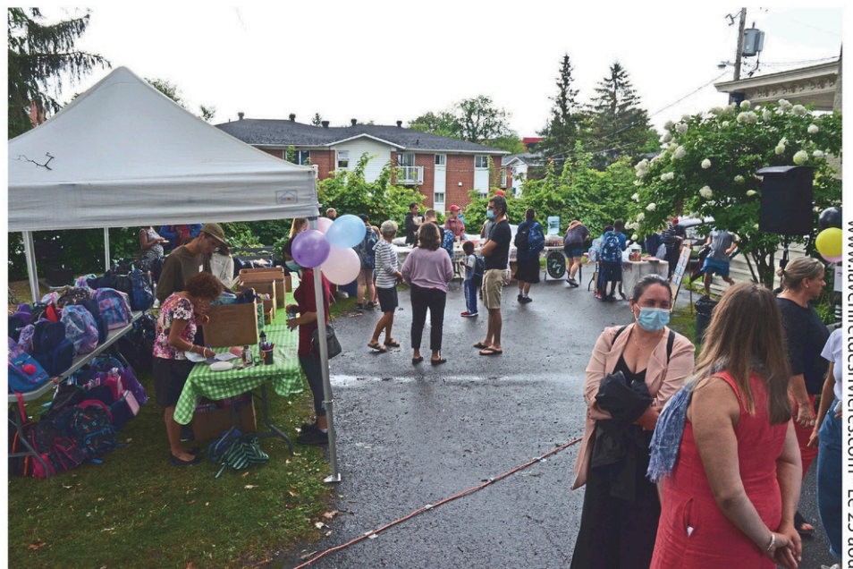
Environ 200 personnes se sont déplacées pour la Fête de la rentrée du Centre de pédiatrie sociale Main dans la main, jeudi dernier, à Cowansville.

La députée provinciale de Brome-Missisquoi et ministre déléguée à l'Éducation, Isabelle Charest, ainsi que la mairesse de Cowansville, Sylvie Beaugard, se sont également déplacées pour l'occasion.