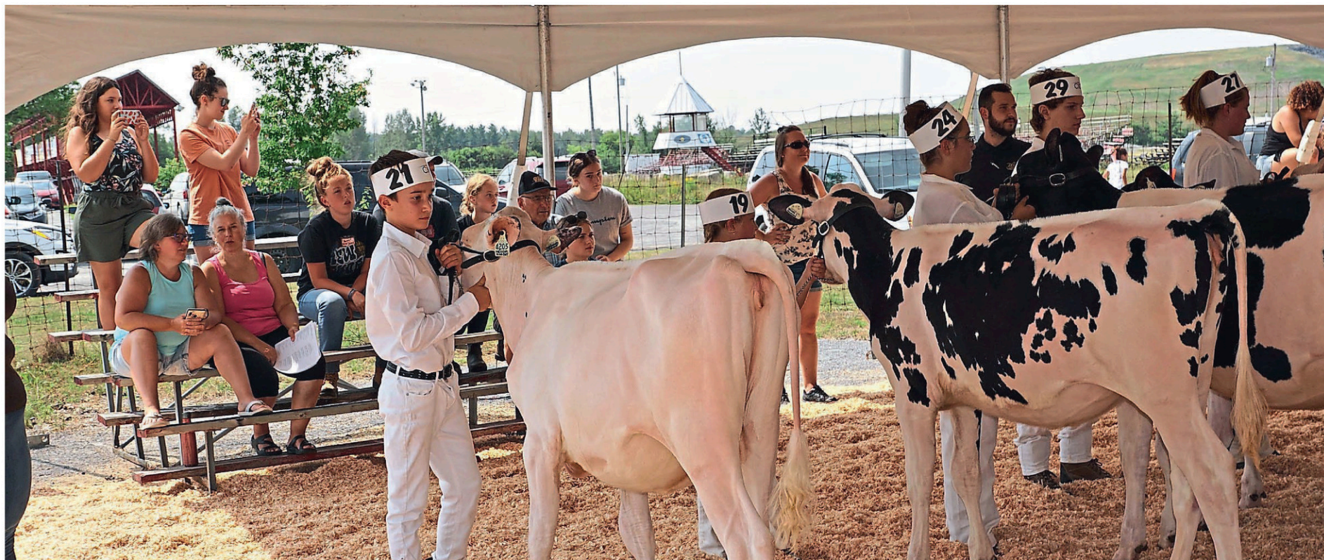
Quarante-cinq jeunes de 5 à 25 ans ont participé au concours

CLAUDE HÉBERT chebert@laveniretdesrivieres.com