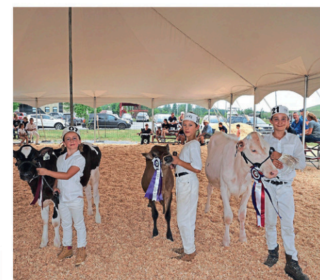
Les gagnants de la journée d'évaluation du jeudi.

Fondée en 1933, le Club Holstein St-Jean regroupe 187 éleveurs des comtés d'Iberville, Missisquoi, Napierville et Saint-Jean. Quelques-uns de ses membres proviennent également des comtés de Brome et de Laprairie.