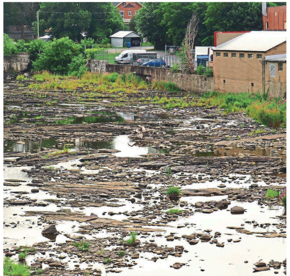
Le lit de la rivière aux Brochets est très apparent à Bedford, le niveau d'eau ne laissant désormais que très peu de place pour les poissons.

« Une baisse du niveau d'eau de surface concorde généralement avec une baisse du niveau de l'eau souterraine. Une situation d'autant plus préoccupante que les nappes