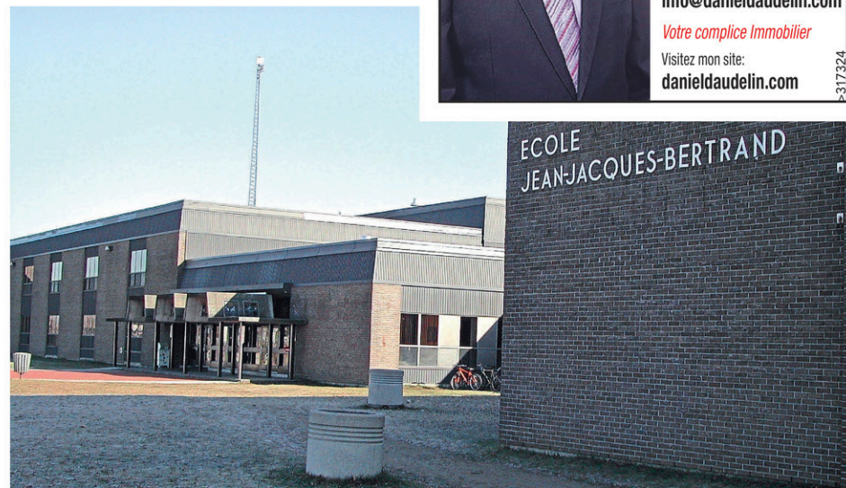
L'école secondaire Jean-Jacques-Bertrand accueillera 50 étudiants de plus que l'année dernière lors de la rentrée automnale.

Le calendrier scolaire prévoit notamment 21 journées de congé et 17 journées pédagogiques de septembre 2021 à juin 2022. Trois