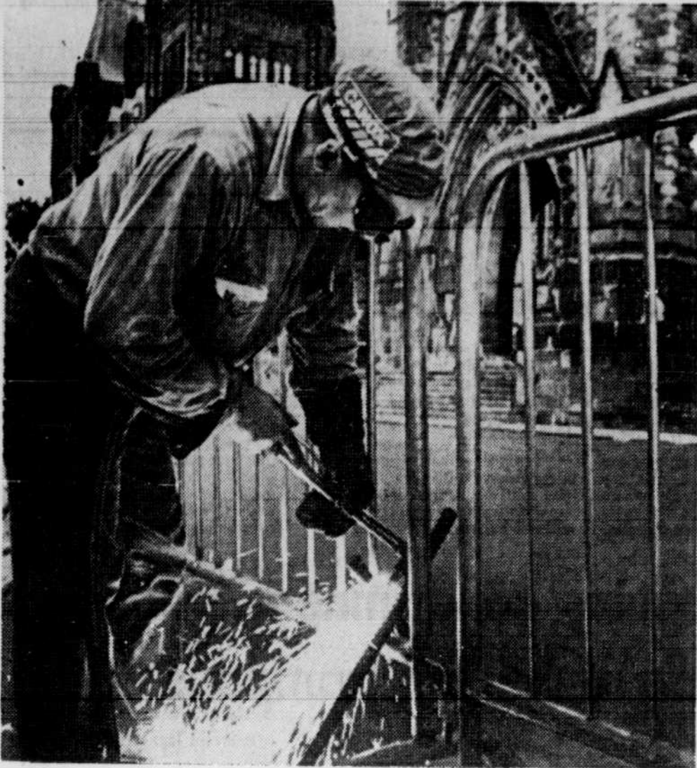
Un ouvrier soudeait, hier, des barricades anti-émeutes en prévision d'une manifestation de producteurs laitiers ontariens prévue pour aujourd'hui. Cette précaution extraordinaire fait suite à une manifestation violente de producteurs laitiers québécois le mois dernier.