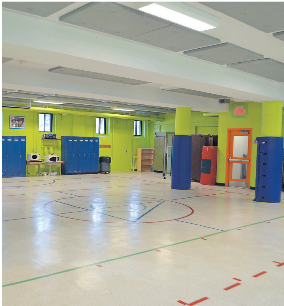
Le plafond de la grande salle servant de gymnase est relativement bas et des colonnes obstruent la surface de jeu.

« L'installation de cet équipement s'inscrit dans le cadre du programme décennal d'accessibilité aux bâtiments publics de la Commission scolaire », prend soin d'ajouter le directeur général de Val-des-Cerfs, Éric Racine.