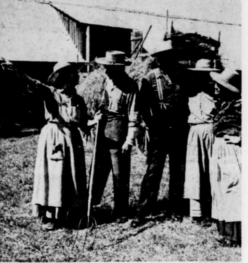
Quelques-uns des personnages du téléroman Le temps d'une paix dont les scènes extérieures sont tournées dans Charlevoix.

Finalement, il y a les retombées non prévues au budget. L'an dernier, il a fallu engager des agents de sécurité pour tenir l'ordre sur un lieu de tournage, dans le rang Saint-Pierre, à Saint-Irénée. On a estimé à 1.000 personnes la foule qui s'était massée là. On n'avait fait aucune publicité. "Je n'ai jamais vu un phénomène pareil", de dire M. Trudel.