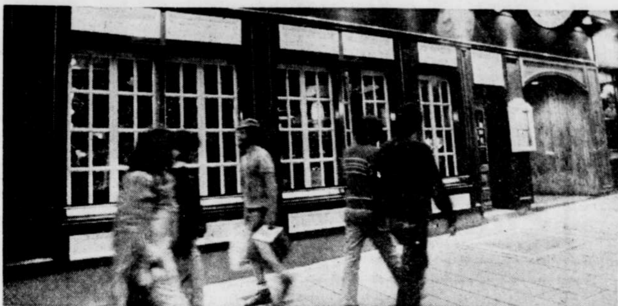
... ou d'une propreté exemplaire."