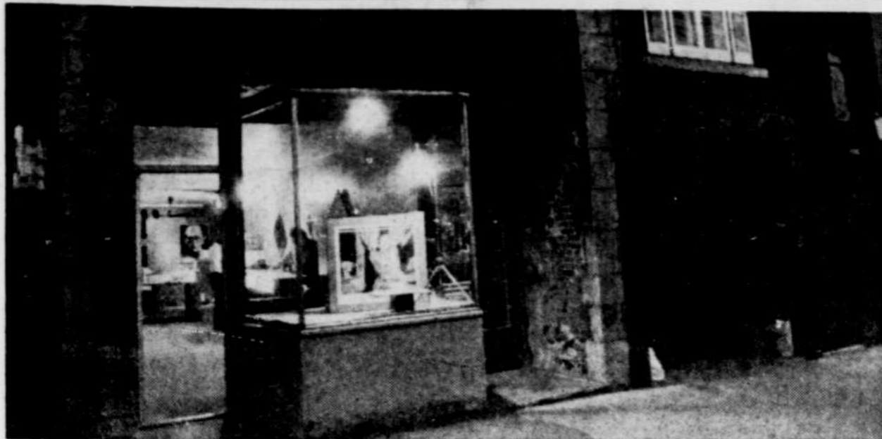
"Des façades tristes et effacées..."